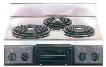
複数口こんろ (前面操作のみ)