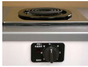
一口こんろ (前面操作) ※写真は富士工業製

身体や物が接触し、意図せずスイッチが「入」となる可能性がある構造であったために、電気こんろの上や周囲に可燃物が置かれていて、火災事故に至る危険性があります。