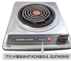
一口こんろ (上面操作)