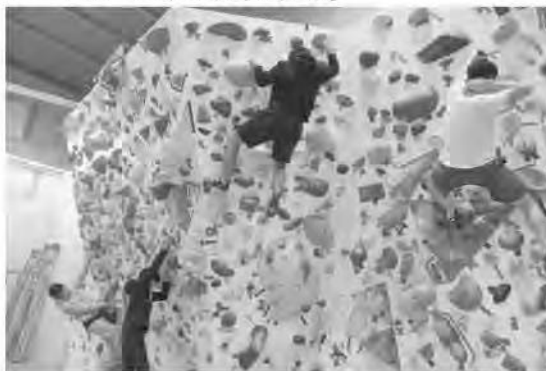
<チャレンジ ザ トップ(山岳競技)>

競技者に必要な能力(身体的・精神的)を引き伸ばすために、競技の専門性を踏まえたトレーニング等を提供する。