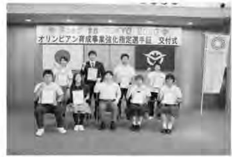
<オリンピック育成事業強化指定選手証 交付式>

オリンピックの育成に向けた事業の対象者になり得る選手の育成環境を整備し、世界に向けた競技力を加速させる。