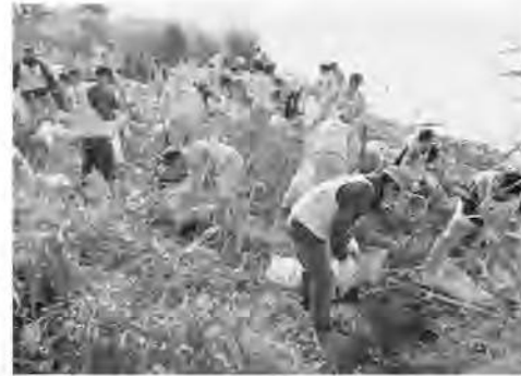
児島湖流域清掃大作戦の状況