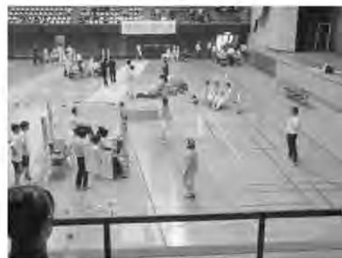
<第72回国民体育大会 フェンシング競技>