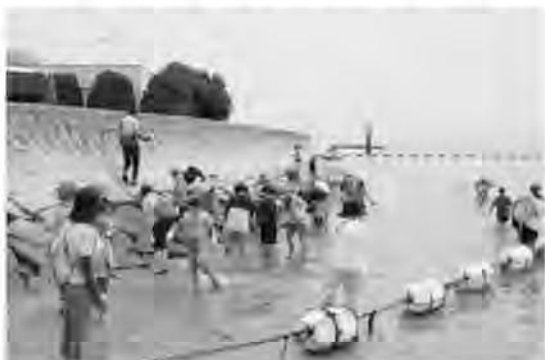
< 環境学習エコツアー >

また、出前講座の充実を図るため、指導者等との協働により学習資材の作成等に取り組む。