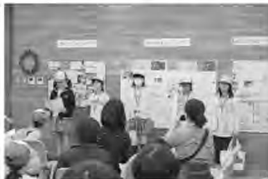
< こどもエコクラブ活動発表会 >