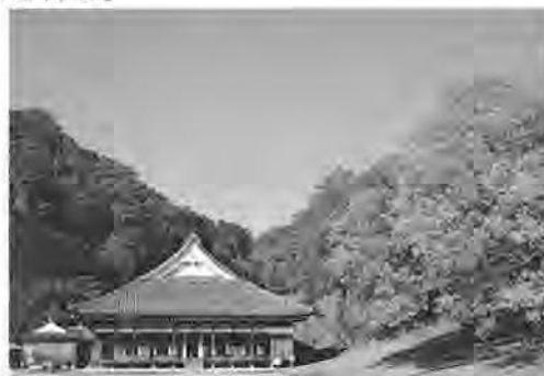
<閑谷背景保全地区>

ポータルサイト「おかやまの景観」を運営し、景観形成に関する諸制度や関係部局が各々保有している景観に関する情報を発信するとともに、写真のみならず見どころやアクセスを掲載した「おかやまの景観百選」を発信し、市町村や住民が一体となって良好な景観の創造に向けて取り組むよう意識の高揚を図る。