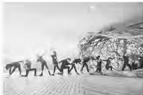
県民文化プログラム(岡山市)