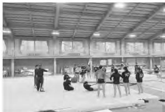
<マルチ サポート プログラム(体操競技)>