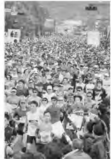
<おかやまマラソン2017>

また、大会開催に向け、県内外へのPRキャラバンの派遣、ランニング教室の開催などにより、大会PRや大会開催機運の醸成に努めながら、県内他大会の実施主体との連携による大会の共同PRやスタンブラリーなどの取り組みも展開し、これらを通じて、本県及び岡山市のスポーツの振興や情報発信、地域の活性化を図る。