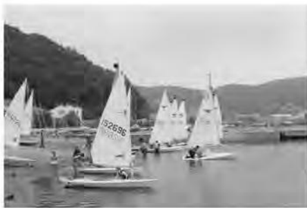
<レッツ チャレンジ!競技体験事業(セーリング)>