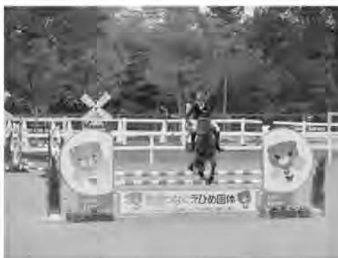
<第72回国民体育大会 馬術競技>