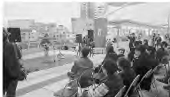
地域フェスティバル(備前)