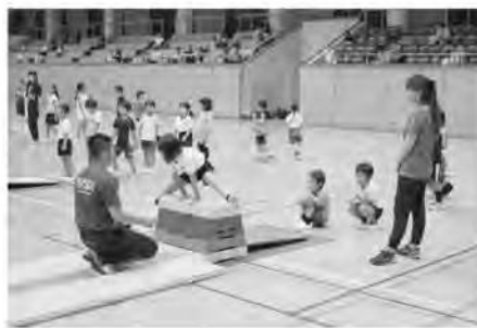
<スポーツ活動奨励事業(器械体操)>