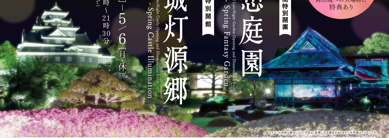
※イベント内容は都合により、予告なく変更になる場合があります。※写真はイメージです。

4月27日[土]・5月4日[土・祝]の 18:00〜 和装でご来園の方は 後楽園 入園無料! 岡山城への入場時に 特典あり