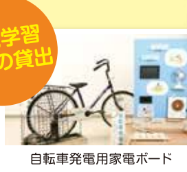
自転車発電用家電ボード