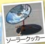
ソーラークッカー