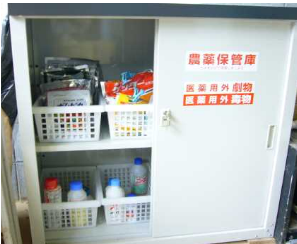
農薬保管庫に劇物・毒物表示