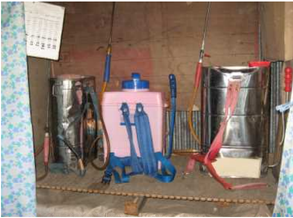
所定の場所での機材の保管