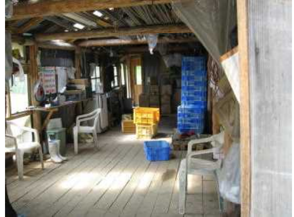
機材等は所定の場所で保管