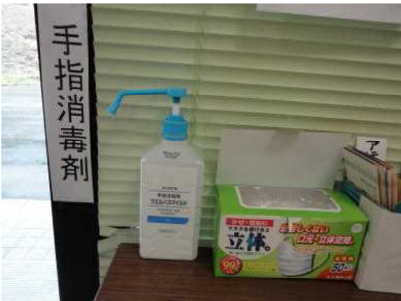
消毒剤やマスクの設置