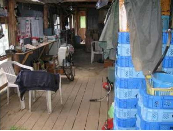
場内で農薬散布機や草刈機が混在