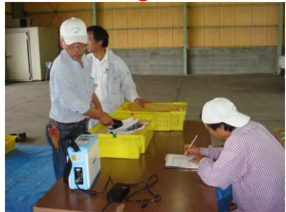
作業台の導入による作業