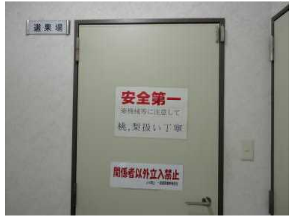
安全第一、立入禁止の掲示