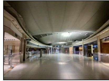
利用者がほぼいないため、店舗が閉鎖されている免税店エリア

—バンコク・スワンナプーム空港の国際線到着数は2月が4割減、3月が4割減、4月はほぼ10割減となっている。（※4月4日以降、外国からの旅客機の飛行は禁止されている）