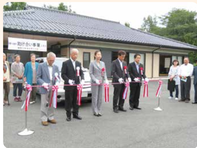
出発式でのテープカット