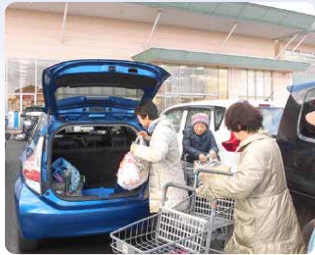
買い物ツアーなら、大きな荷物もスタッフの車で運べます。