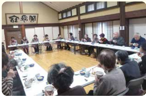
取材させていただいた日の行き先は給食サービス「たんぽぽ」でした。