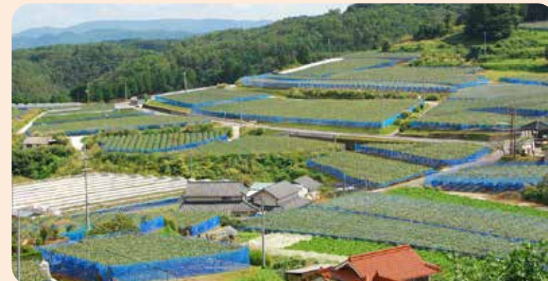
運転手と付き添い係の集合場所からスーパーまでは直行すると20分程度で着きますが、個々の家を回るの、1時間程度かかります。

新見市豊永地区。新見市南部の標高約300メートルの山あいの地域です。以前は日本有数の葉たばこの生産地でしたが、現在では山の斜面に壮大なピオーネ畑が広がっています。 平成28年2月に開催された豊永地区小地域ケア会議で買い物難民の議題が出たのをきっかけに行った、アンケートと聞き取り調査の結果、買い物ツアーを利用したいという声が上がり、平成29年7月から豊永地区福祉ネットワークが市社会福祉協議会の車を借りる「豊永地区買い物ツアー」の運行を開始しました。 運行は月2回で2班に分かれ、それぞれ月1回利用できます。最初9人だった利用者も現在（令和元年12月）では、15人に増えました。 利用者は、主に近くに買い物できる場所のない75歳以上の一人暮らし高齢者の方若しくは80歳以上の高齢者のみの世帯の方です。（参加しない場合のみ、民生委員に連絡します。） 支援者は36人で、運転手1名、付き添い1名でふもとのスーパーへ向かいます。必要な方には、買い物中も付き添います。利用者が