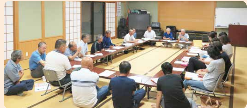
スタッフ会議の風景