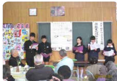
小学 6 年生 学習成果発表 ～荏原の「伝統文化」を学んで～