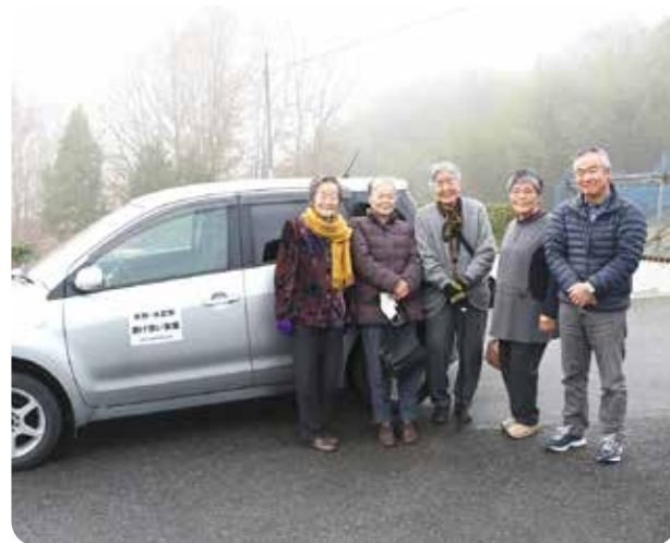
スタッフと利用者の皆さん

助け合い事業の成果としては、住民の助け合い意識の向上や生きがいの創出、高齢者の交流の場や見守り活動につながっていることが挙げられます。