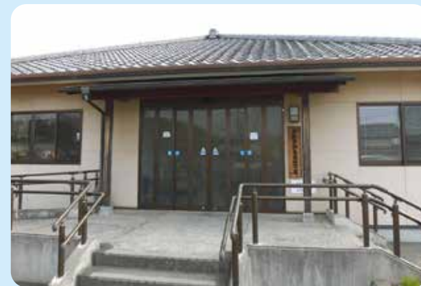
「独り暮らしの会のぞみ会」の会場 倉敷市柏島東憩の家

倉敷市玉島八幡地区で平成2年頃から開催されてきたレクリエーションと昼食を楽しむ「独り暮らしの会のぞみ会」（以下のぞみ会）。かつては、参加者の家族や民生委員が送迎を行っていました。平成28年に玉島南小学校区小地域ケア会議で、民生委員が行ってきた送迎について、事故等に対する不安が議題に上がりました。のぞみ会を閉鎖させるという話も出ましたが、「通いの場」をなくすべきではないとの意見が上がり、デイサービスの空き時間に車を借りることはできないかと松園福祉会に相談がありました。保険の関係があるので、施設の職員が運転することを条件に車の貸し出しをすることになりました。平成29年7月から運行を開始。2ヶ月に一度開催されるのぞみ会への送迎を無料で行っています。送迎ルートは、利用者の体調等をふまえ、座席に座っている時間を短くするなどの配慮をし、民生委員が考えています。