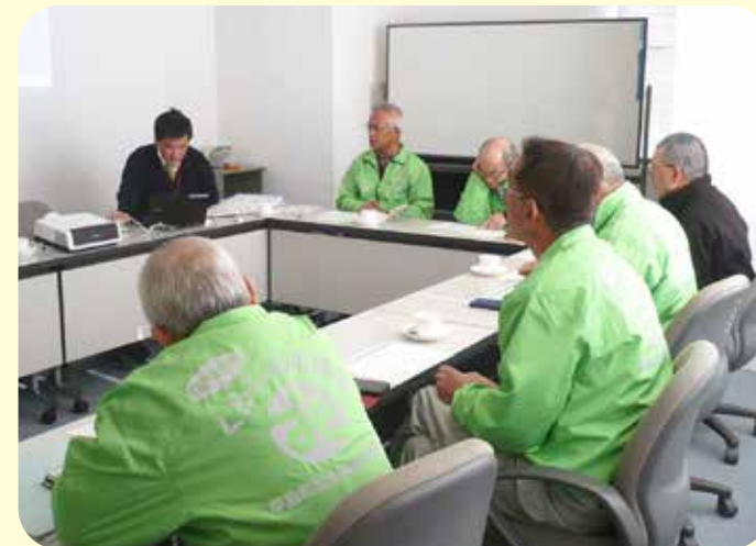
くるりん定例会（令和2年1月）

健康増進や引きこもり防止、社会参加、仲間づくりを目的に、早島町内の各地区で開催されている「ふれあい・いきいきサロン」や「高齢者給食サービス」（会食）の活動場所への移動が困難な方を対象として、町社協所有の車による送迎を無償で行う活動です。