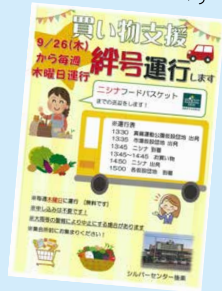
買い物支援「絆号」チラシ

平成30年の西日本豪雨の被災者支援に、社会福祉法人ができる取組がないかと、倉敷市社会福祉協議会から、声がかかり、他の地域で実施している移動支援等を参考に買い物支援についての協議を進めていきました。 令和元年6月特別養護老人ホームシルバーセンター後楽の近くにある真備総仮設団地、市場仮設団地の住民を対象に、週1回、買い物支援「絆号」を運行して、近くのスーパーまでの送迎を開始しました。 併設のデイサービスの車両の空き時間を利用し、社会福祉法人の職員が運転を行っています。 開始当初は、利用者が集まらない日もありましたが、曜日を変えたり、チラシを作ったりして、徐々に活動が広がっています。 今後も、社会福祉法人として、地域に貢献出来るよう、他の機関と連携し、協力していきたいと考えています。