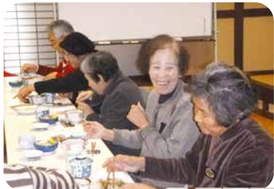
利用者の方の笑顔がとても印象的でした。