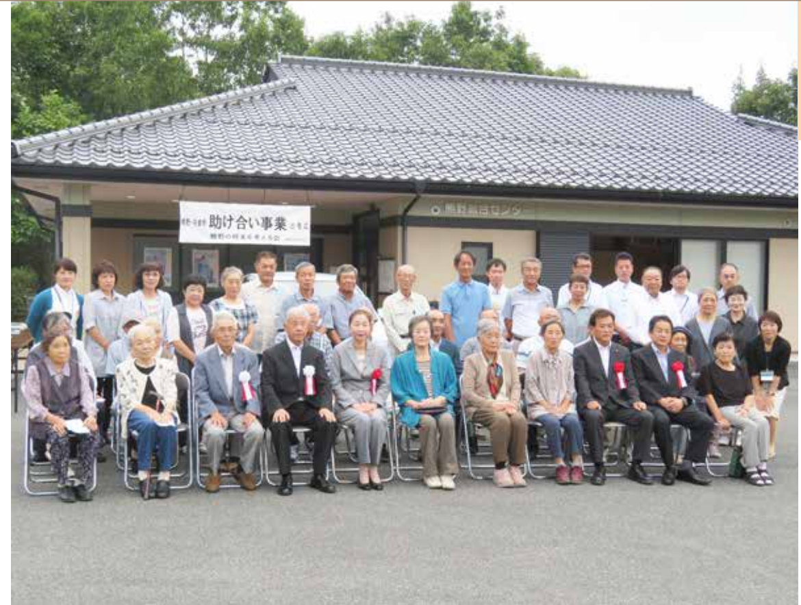
「助け合い事業」 出発式

新見市南東部に位置する熊野・井倉野地区は、約100世帯260人が生活し、高齢化率は43%です。助け合い事業を始めるきっかけとなったのは、誰もが安心して住み続けられる地域を目指し、住民同士の助け合い活動につながるため、平成29年に地区住民を対象に実施したアンケート調査です。日常生活の中で「どんなことに困っているか」、「どんなお手伝いができるのか」を調査した結果、要望の多かった送迎支援と生活支援の実施に向けて協議を始めました。 送迎支援の実施に当たっては、道路運送法の制約など多くの課題がありました。研修会やスタッフ会議を重ねた結果、課題や不安を払拭することができたので、平成30年9月に出発式を行い、助け合い事業をスタートさせました。 ここでの送迎支援は、レンタカーを使用し、住民ボランティアが運転手となって、主に新見市中心部の病院やスーパーに高齢者等を送迎しています。レンタカー代等の経費は、新見市から「熊野の将来を考える会」など地域運営組織に