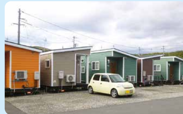
トレーラーハウス型仮設団地

倉敷市船穂町柳井原にあるグリーンビレッジ瀬戸内。特別養護老人ホームやデイサービスなどを運営しています。隣の敷地には、平成30年7月豪雨の被災者が居住する、トレーラーハウス型仮設団地があります。 グリーンビレッジ瀬戸内では、2か月に1回、地域住民の代表者等が集まって運営推進会議を開催しています。この会議において「仮設団地入居者の方が、買い物に行くための交通手段がなくて困っている」との話しが出ました。 そこで、地域福祉の拠点を目指しているグリーンビレッジ瀬戸内として、入居者のために一役買わせて頂きたいとの思いから、平成31年2月から倉敷市真備町のスーパーや病院への送迎を始めました。 希望者は毎週水曜日の13時までに仮設団地内の集会所前に集合します。15時30分までに集会所に戻る範囲であれば、一人一人の要望に対応しています。郵便局、銀行、農協やお墓参りなどにも利用できます。 仮設団地の入居者は減少しておりますが、送迎の利用者も減少傾向にありますが、要望がある限りは続けます。