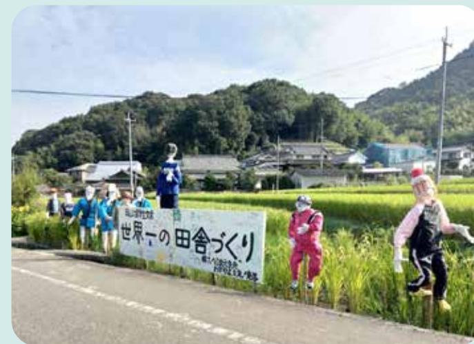
元気集落事業で岡大留学生と一緒に作った看板 季節によってはユニークな案山子も訪れた人を歓迎

矢掛町を東西に横断する国道484号線や小田川の南側に位置し、町の中心地にも程近い江良地区。高齢化が進み、高齢者のひとり暮らしや老夫婦のみの世帯が増加しています。公共交通手段が乏しく、自家用車、バイク及びタクシーを利用して通院や買い物に行かざるを得ない状況です。町の地域福祉バス（ふれ愛バス）は運行されていますが便数が少なく、利用すると1日仕事になってしま