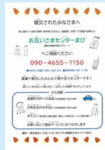
お互いさまセンターまびのチラシ

平成 30 年 7 月豪雨災害前より、倉敷市真備町内では、医療、福祉関係者が集まり「真備地区関係機関・事業所等連絡会（真備連絡会）」で地域包括ケアを見据えながら連携を図っていました。 平成 30 年 7 月 7 日の発災後、「真備連絡会」の有志が集まって、自分たちの事業所も被災した街の復興のために何か出来ることがあるはずと、8 月 25 日に 1 回目の協議を行いました。 9 月 3 日の 2 回目の協議の時には、「お互いさまセンター」の立ち上げを決め、「今必要なのは移動支援ではないか」と動き出し、11 月 1 日に「お互いさまセンターまび」を開設することとなりました。 主な活動内容は、移動支援と生活支援（日常生活のお手伝い）です。利用者は、被災された 65 歳以上の高齢者、障がいのある人、子育てで支援が必要な人等です。 移動支援を行うドライバーは、被災された方や再建を待っている方をパートで雇用しています。 日常生活のお手伝いでは、センターの事務所と同じ建物にある精神障がい者の作業所の利用者もスタッフの一員として働いています。