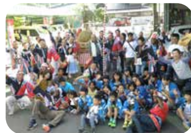
神輿かつぎもみんな

こうした人と文化の交流（世代間、留学生と地域、留学生同士）・グローバル化の他、特産物の開発（ステビアの試験栽培）、岡大生による江良地区の宝物探し（地域の魅力調査）などにも取り組まれています。