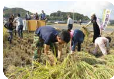
留学生と一緒に稲刈り

「元気集落として、留学生との交流中心から、地域住民の生活支援も」との思いから始めました。今は土日の買い物中心ですが、平日でも自分や他の動けるメンバーが送迎するので、病院の送迎も是非相談してほしいと思います。