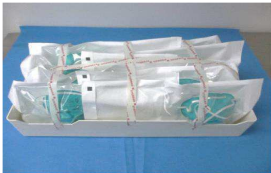
図 1：ロード用の N95 マスクの包装とトレイへの積載例