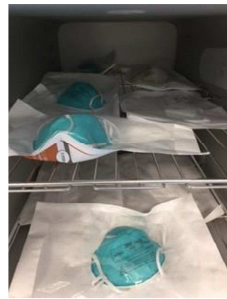
図 2：ロード用の N95 マスクの包装と棚への積載例