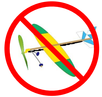
模型航空機の飛行