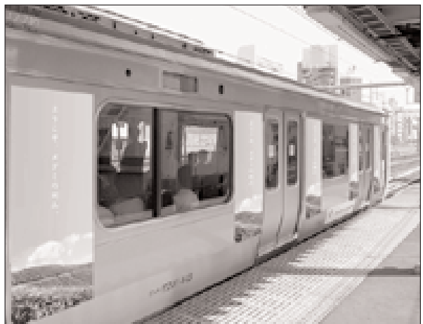
■ 山手線外側（写真上）、車内吊り（写真左）のイメージ広告