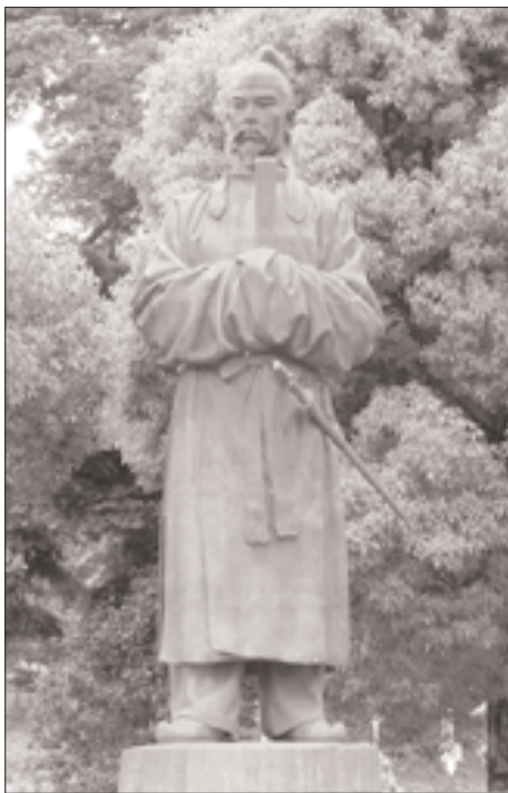
岡山県和気郡和気町芳嵐園内 朝倉 文夫 作

この朝倉文夫の石膏像は、檀原神宮に献納され、戦後は奈良県立檀原考古学研究所付属博物館で所蔵されていたが、昭和五十九年に清麻呂生誕一二五〇年を記念して、和気町が譲り受け、郷土のシンボルとすべく銅像にし、和気神社の外苑芳嵐園に建立されている。