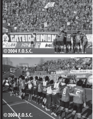
是非スタジアムに足をお運びいただき、今後ますますの高みを目指すフアジャアノ岡山への熱い応援をお願いします。

入場者数の増減は、天候や日程等さまざまな要因がありますが、継続して多くの方に観戦に来てもらうためには、地域と密接に関わり、地域活性化の翼を担っていくことが重要であるとの思いから、今シーズン、「Challenge1」を掲げ、その取組を進めています。「Challenge1」には、スタジアムで1万人のサポーターが1つになり、岡山の皆さまと共に「次の1」つまり「J1」にふさわしいクラブとなることを目指したいとの思いが込められています。