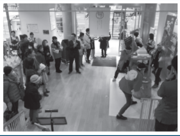
新庄村「ひめのもち」 新年餅つき大会

●ここで、最近の売れ筋商品の紹介。 はつきく大福いちご大福／聖和堂(岡山市) 季節により、みかん大福、ピオーネ大福、