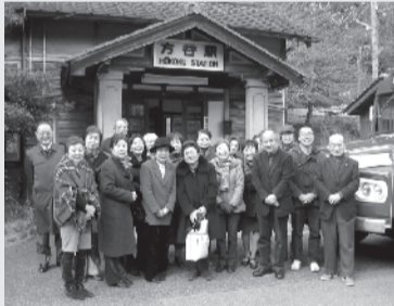
平成26年度 岡山旅行