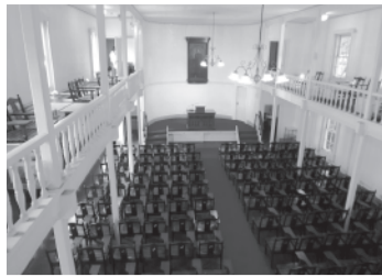
慶應義塾三田演説館

木堂は、明治八年（一八七五年）七月に上京し、共憤義塾等を経て福澤諭吉の慶應義塾に学んでいる。慶應義塾は、明治八年に木堂二階建ての演説館（重要文化財）を建設した。西欧文化の移植に務めた福澤が、スピーチを演説と訳し弁論を普及させるために建てたものである。