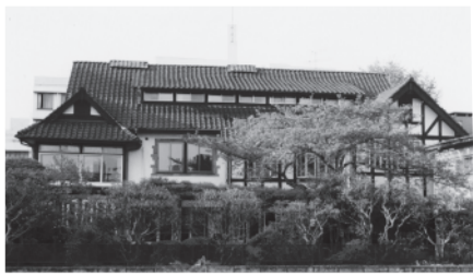
解体直前の木堂邸宅（平成11年）

犬養が弁説を練磨し、その基盤を構築した由緒ある建物である。木堂は、秀才抜群で常に首席であったが、卒業直前の試験で二位になったのを機に、学んで及ばざるは慙愧に堪えぬと述懐して、明治十三年（一八八〇年）卒業直前の八月に退学した。恩師、福澤諭吉は、卒業可否は問題とせず、犬養を高く評価し、生涯にわたって支援した。