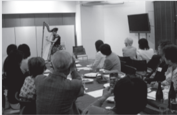
平成27年度 総会・交流会