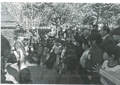
大村智先生と地元民の交流