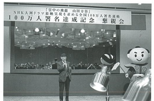
大村智先生来賓挨拶