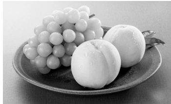
白桃とマスカット

新橋館は鳥取県との共同運営。1階の物販店舗では、初夏から秋にかけて、らっきょう、スイカ、桃、梨、ぶどうと山陰、山陽の季節ごとの特産品を途切れることなく提供しています。くだもの王国おかやまを代表する白桃は「清水白桃」や「おかやま夢白桃」などバラエティー豊かな品種が数週間単位で入れ替わり登場します。ぶどうは、大粒、種なし、皮ごと食べられるシャインマスカットや瀬戸ジャイアンツが大人気の商品。ポリっとはじける食感とフレッシュな果汁をお楽しみください。白桃は7月上旬から8月下旬まで、ぶどうは7月下旬から10月下旬まで取り扱っています(時期により品種が変わります)。