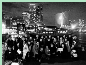
昨年12月13日に開催したクリスマス会・納会の様子