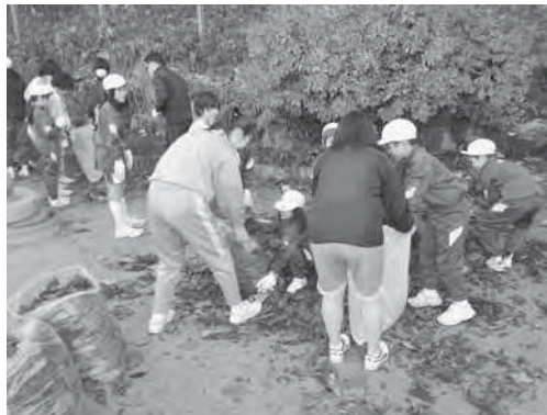
小中合同ボランティアの一場面

ています。地域ボランティアの方々にも参加していただき、また、幼稚園にも出向き園児と一緒に園庭の清掃を行っています。