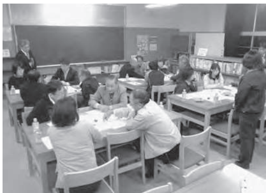
学校運営協議会の一場面