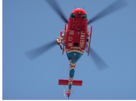
赤磐市総合防災訓練