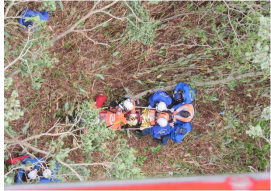
鏡野町救助活動(平成26年6月20日)