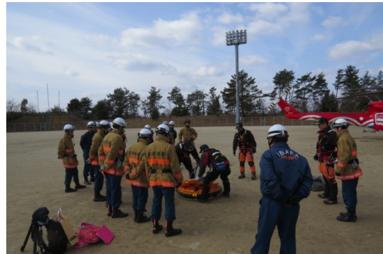
井原地区消防組合消防本部との連携訓練