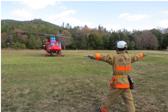
総社市消防本部との連携訓練