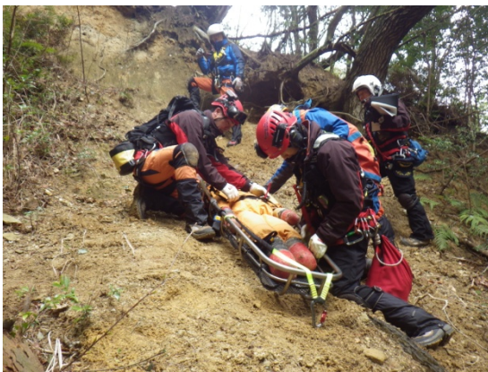
香川県防災航空隊合同訓練