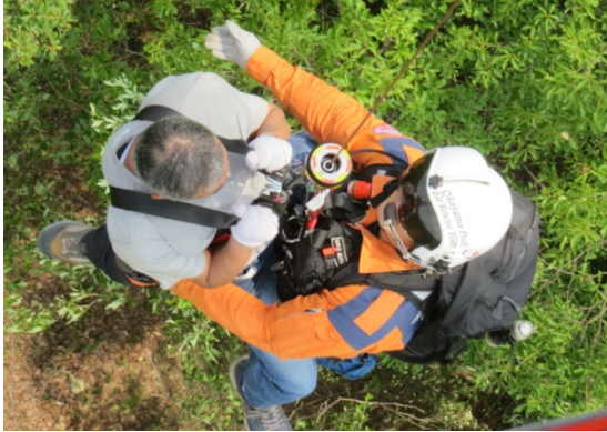
吉永町救助活動(平成26年6月20日)