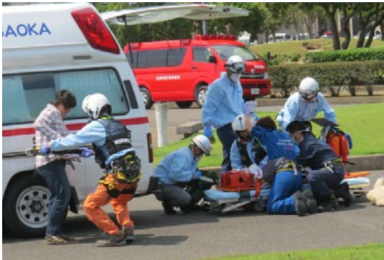
笠岡市救急搬送(平成26年6月7日)