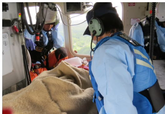
新見市救急搬送(平成26年7月10日)