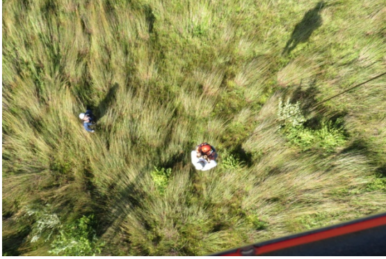
倉敷市総合防災訓練