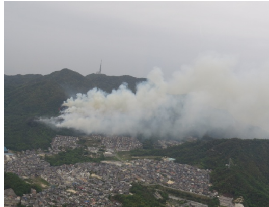
広島県呉市 林野火災(平成26年5月12日)