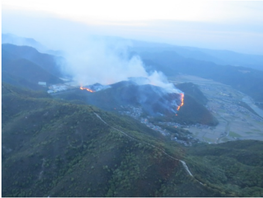
兵庫県赤穂市林野火災(平成26年5月11～12日)