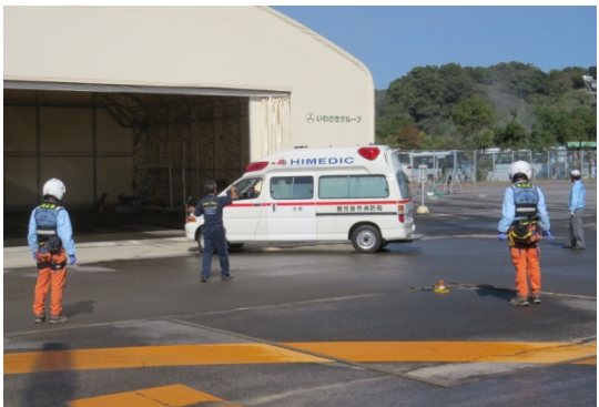
倉敷中央病院～鹿児島県 天陽会中央病院(平成26年11月7日)