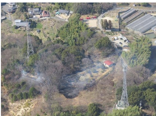
林野火災 早島町 (平成30年3月14日)