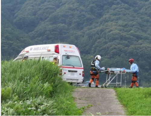
救急搬送 岡山市 (平成29年7月12日)