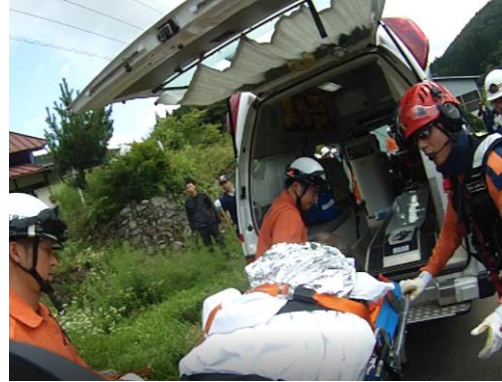
その他救助 新見市 (平成29年7月19日)