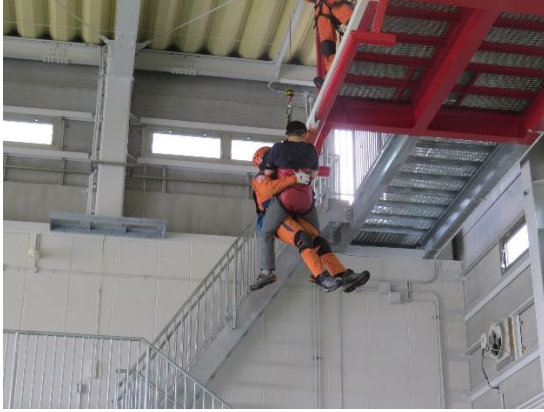
岡山赤十字病院連携訓練