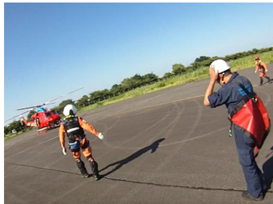
川崎医科大学附属病院連携訓練