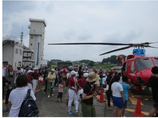
津山圏域消防組合消防本部1日消防士体験