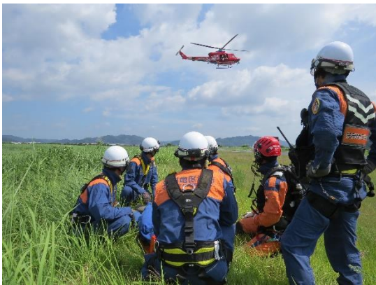
笠岡地区消防組合消防本部連携訓練