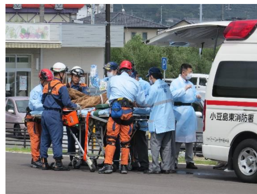
転院搬送 香川県 (平成29年9月6日)