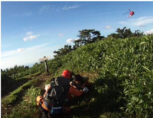
山岳救助 真庭市 (平成29年8月4日)