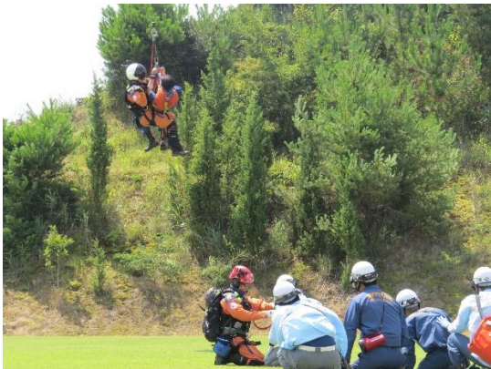
瀬戸内市消防本部連携訓練