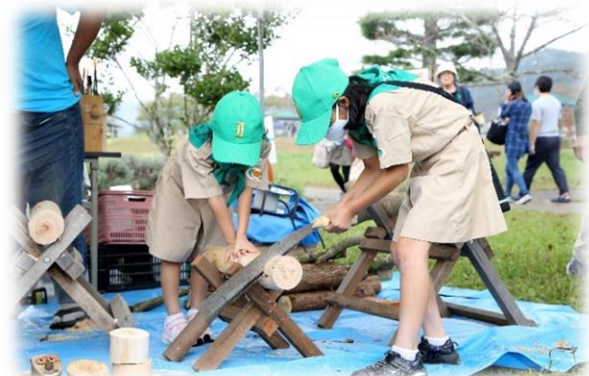
みどりの少年隊活動の様子