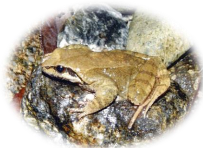
ナガレタゴガエル