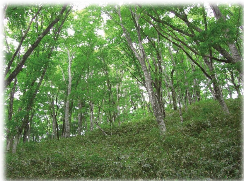
毛無山のブナ林（新庄村）

また、岡山県指定名勝に指定している道祖溪や天神峡、弥高山などを「岡山県文化財保護条例」に基づき適切に保存・管理します。