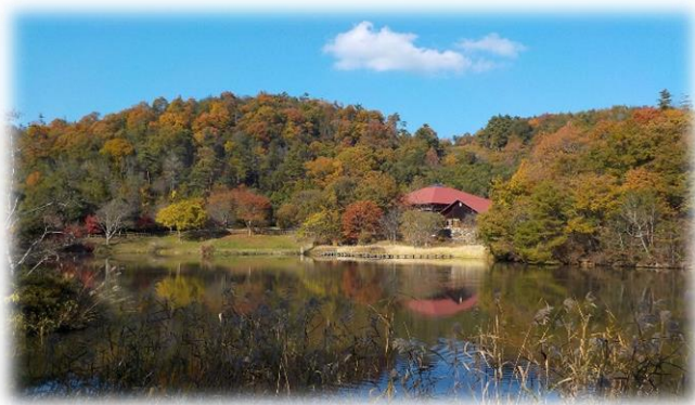
岡山県自然保護センター（和気町）