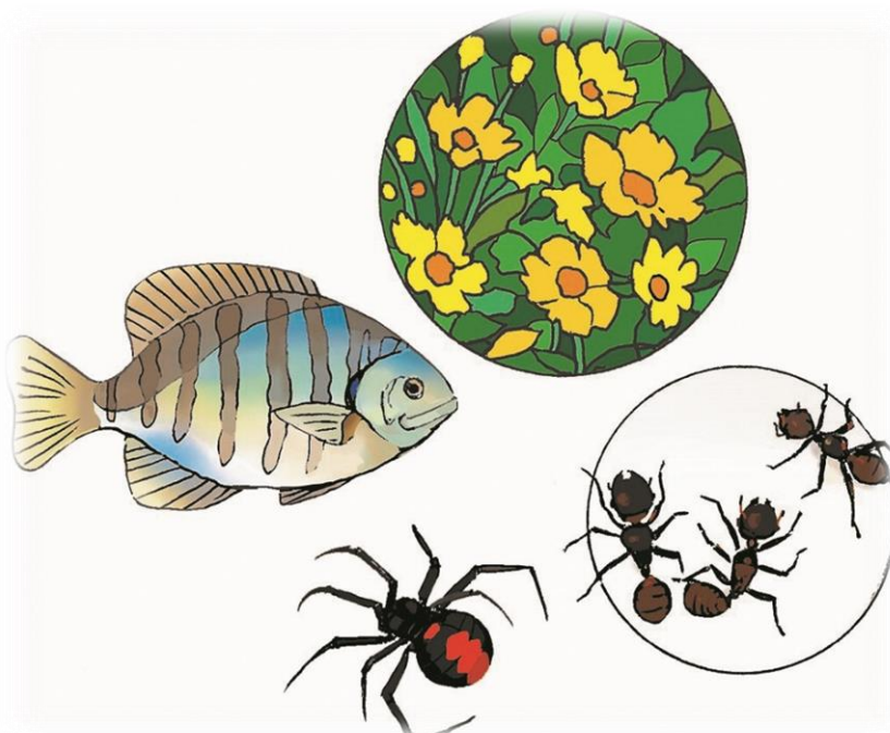
上：オオキンケイギク 左：ブルーギル 右：ヒアリ 下：セアカゴケグモ