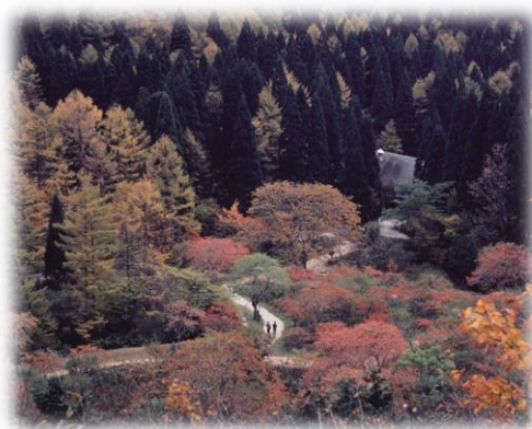
岡山県立森林公園（鏡野町）