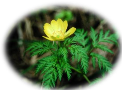
ミチノクフクジュソウ