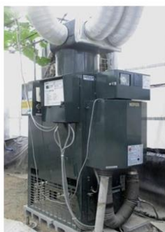
図1 炭酸ガス発生機

内容：ナスは本県の野菜で生産額が最も多い品目で、このうち約半分を施設ナスが占めています。そこで、生産性向上のために産地にも導入が進みつつある炭酸ガスの施用効果をさらに高めるため、天候に対応した炭酸ガス施用技術の確立により、生産者の所得向上を図ります。