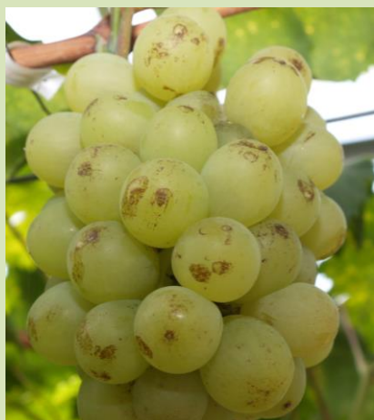
チャノキイロアザミウマによる果実被害

内容：ブドウ栽培において果粒の被害が問題となるアザミウマ類について、県内での発生動態や薬剤感受性を調査し、それに基づいた安定して効果の得られる防除対策を開発します。