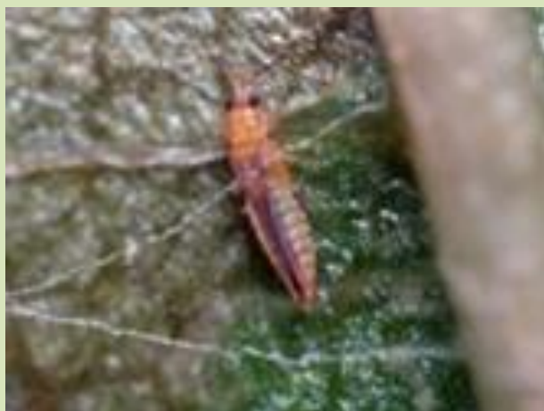
チャノキイロアザミウマ(成虫)