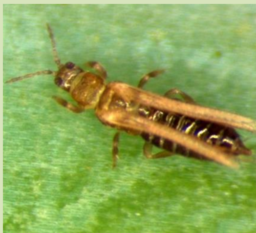
ネギアザミウマ(成虫)