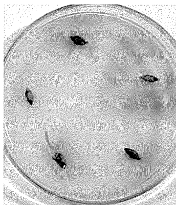
図1 Fusarium graminearum に感染したオオムギ汚染粒による培地の赤変 (25℃, 4日間静置後の素寒天培地)

そこで、上記の素寒天培地を赤変させる赤かび病菌を同定し、本法の有効性を検討したので報告する。なお本試験の実施に当たり、菌株の分譲並びに貴重なご助言をいただいた東京家政大学 一戸正勝教授に厚く御礼申し上げます。