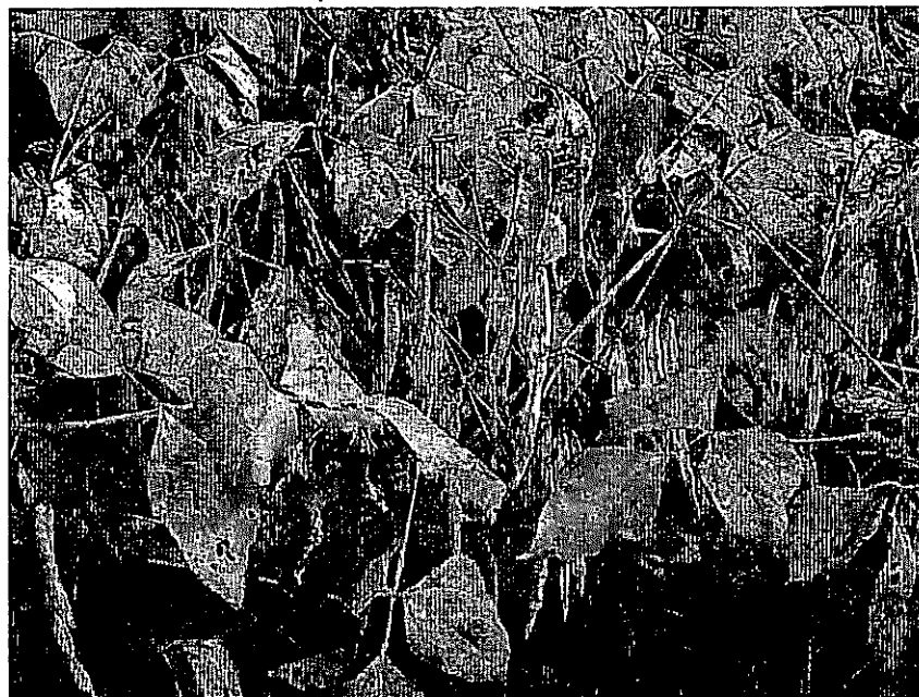
写真1 小豆「夢大納言」の成熟期

日本特産農作物種苗協会（1981）種苗特性分類調査報告 書「あずき」. 財団法人日本特産農作物種苗協会，東 京，pp.1-55.