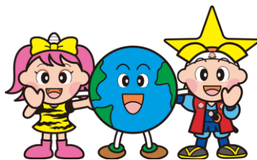
岡山県マスコット「ももち・うらっち」