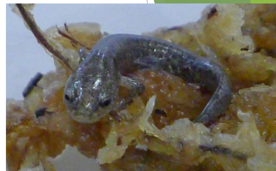
カミサンショウウオ

県のほぼ中央部に位置する 標高200～500mの内陸地域 で、 土地の約70%を山林が占める 。地域の中央部を一級河川の旭川が南北に流れている。気候は、 温暖な瀬戸内海式気候 であり、 水稻中心の農業 を行っている。山の芋（つぐね芋）や椎茸等の県下有数の生産地。