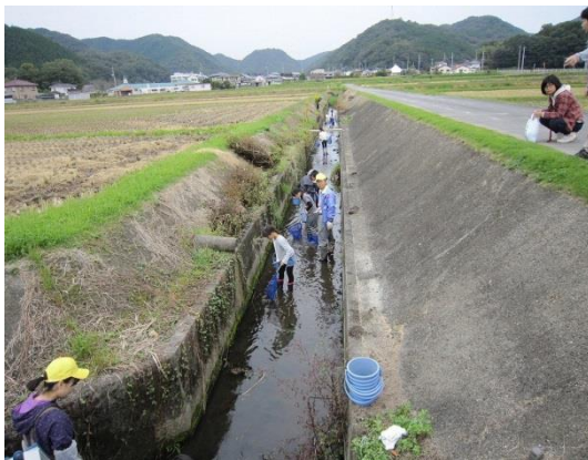
用水路の生き物調査