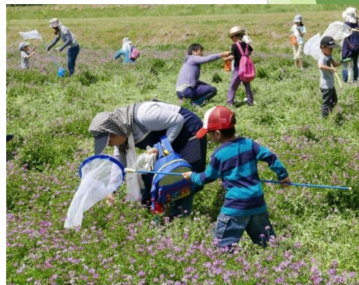
レンゲ畑で昆虫調査