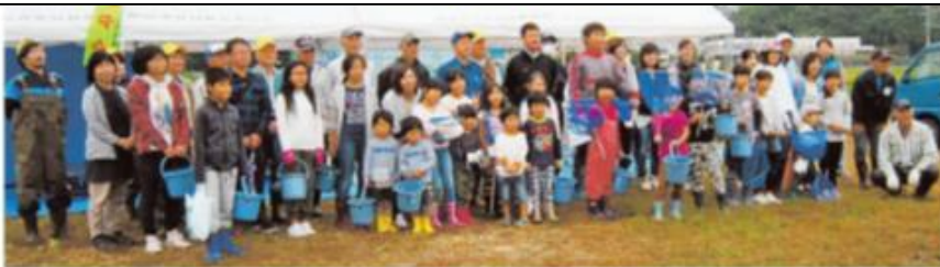
山陽新聞朝刊に活動を掲載 2017/2/16

また、自主防災会と連携し、災害発生時における情報収集や伝達、避難誘導等について自主的な 防災活動 を実施。地域が一体となって防災力の強化に取り組む。