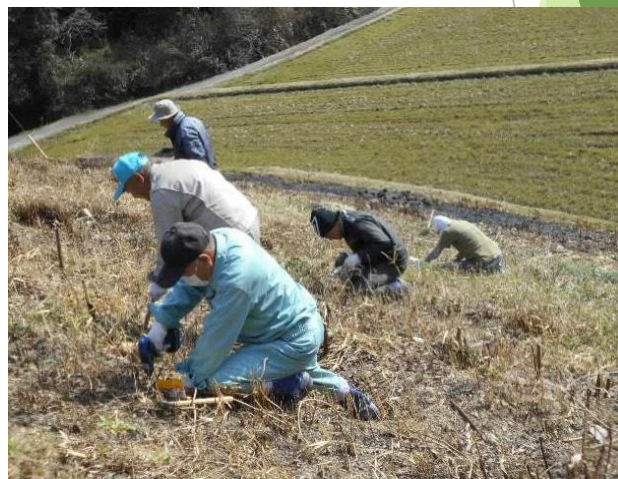
ため池法面の植物除去

ため池の堤体がイノシシに掘り荒らされないよう、法面に生えた植物の根に電動ドリルで穴を開け、薬剤を注入し枯渇させる等の維持管理を実施。