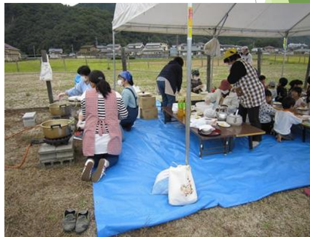
非常時の炊き出し訓練 （婦人組織との連携）

母谷里山保全会、池干し・芋掘り」 ○10月22日 玉松徳経転跡地（岡山県） 30人の親子が、たけのこと田代秋の生き物園、 外菜畑の除去を行った。ヤゴや、ホタルの幼虫 が見つかった。その後、休耕田を耕し、芋畑で 芋掘りを行い、地元の新米おにぎり、餅など一 緒に大学で食べてもらった。参加した子ども たちは里山の自然を楽しんだ。（大野克典）