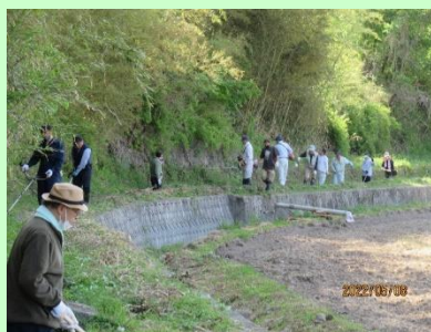
住民一体となった清掃活動

約450年前から続く「新町地蔵踊り」を、多面的機能支払交付金の活動として新和会や近隣の小学生と連携し実施しており、本年度も開催することができました。