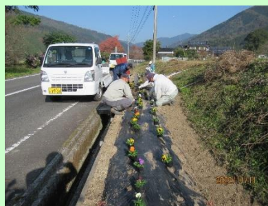
通学路に沿った植栽活動