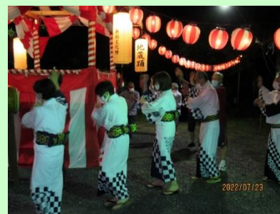
農村文化「新町地蔵踊り」