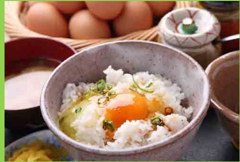
「たまごかけごはん」にも棚田米を使用