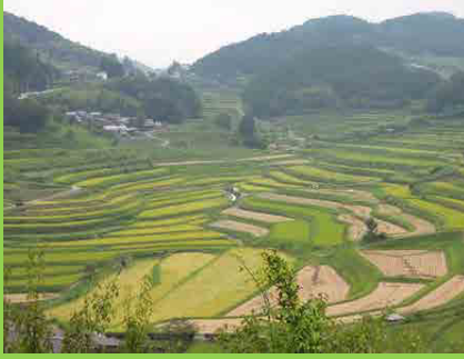
南東側より大併和西の棚田を眺める