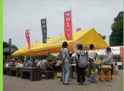
「棚田きんちゃんまつり」での交流の様子