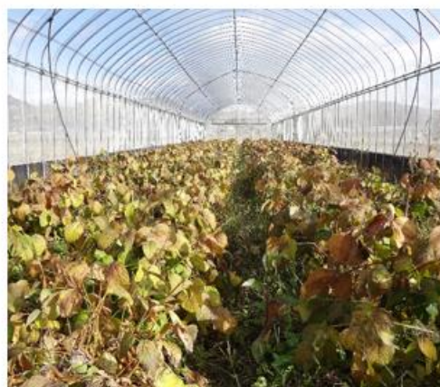
「岡山系統1号」の原原種生産 H17から継続