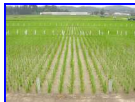
県の新品種、系統の導入に係る奨励品種決定調査の位置づけ