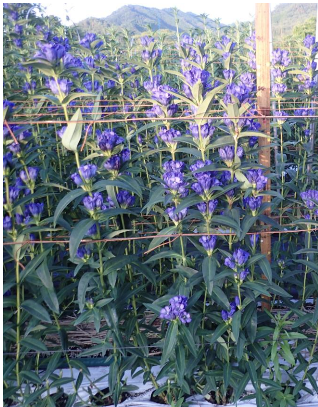
岡山RND4号(圃場での開花状況)