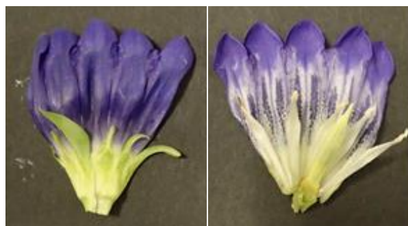
花の拡大写真(上:岡山RND4号、 下:No. 47)