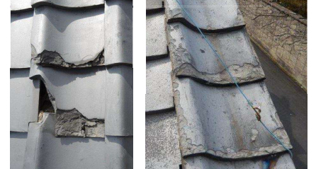
瓦が著しく破損している例