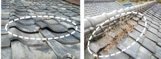
瓦に浮き上がりが生じている