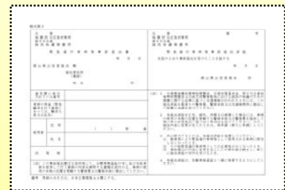
緊急通行車両等事前届出書