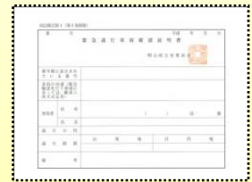
緊急通行車両確認証明書