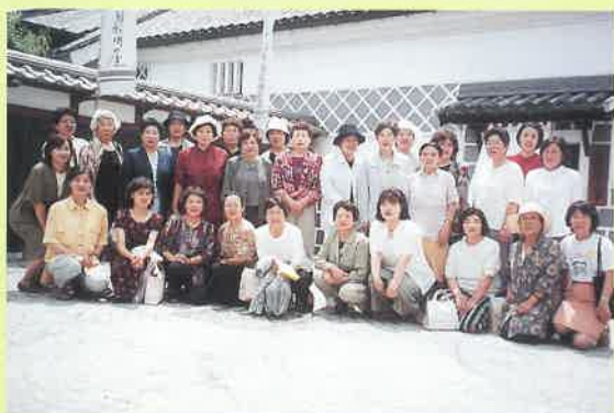
むかし下津井回船間屋にて

フォーラムの活動はもとより、町内、町外のさまざまな学習会に積極的に参加しています。昨年より、町からの委託を受けて、男女共同参画社会推進のための講座を年5～6回実施しています。行政とよき連携を取りながら、会員がそれぞれの立場で積極的に動くこと、そして「和」をモットーに男女共同参画社会の実現をめざし、より多くの生涯学習の場を提供することで地域に貢献していきたいと思っています。