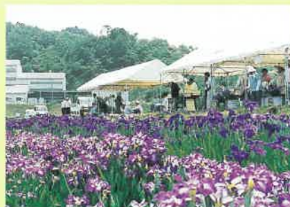
平成10年6月1日 しょうぶ祭り

現在、私たちは各地区の花壇整備、球根の植え付け、視察研究、勉強会、町内のイベント参加、菖蒲園管理(祭り)、ハーブ研究会などの活動を行っています。