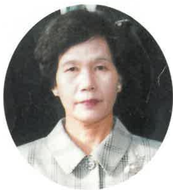
岡山県男女共同参画推進センター 所長