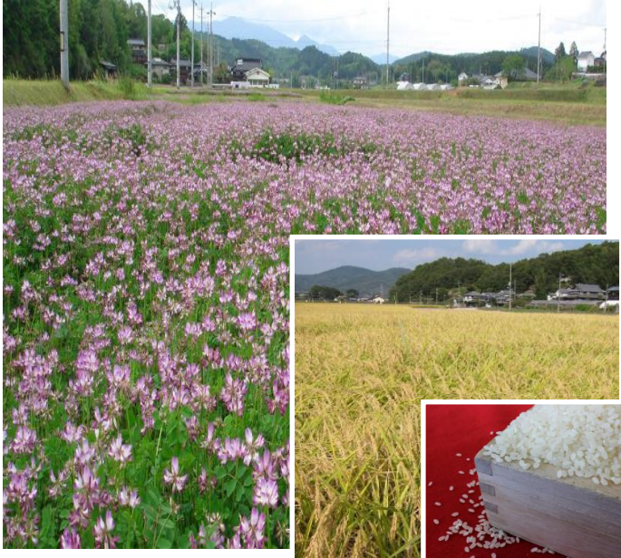
レンゲを利用した稲作