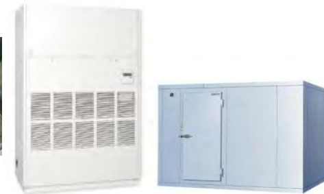
温度管理を要する装置・設備の導入