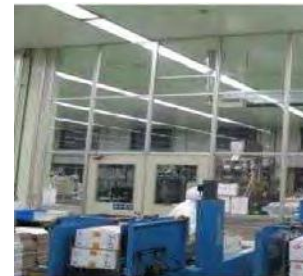
空気を経由した汚染の防止設備（パーティション）の導入