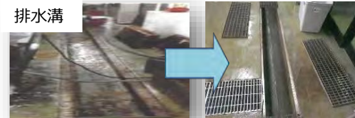
施設の衛生管理の強化に向けた排水溝、床、壁等の改修