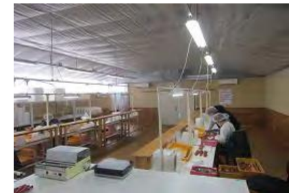
パッキング設備の導入