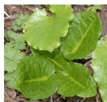
若い葉(左上1枚は別植物)