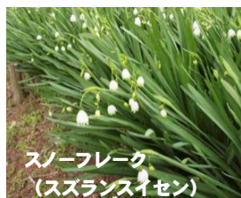
スノーフレーク (スランスイセン)