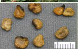
チョウセンアサガオの種