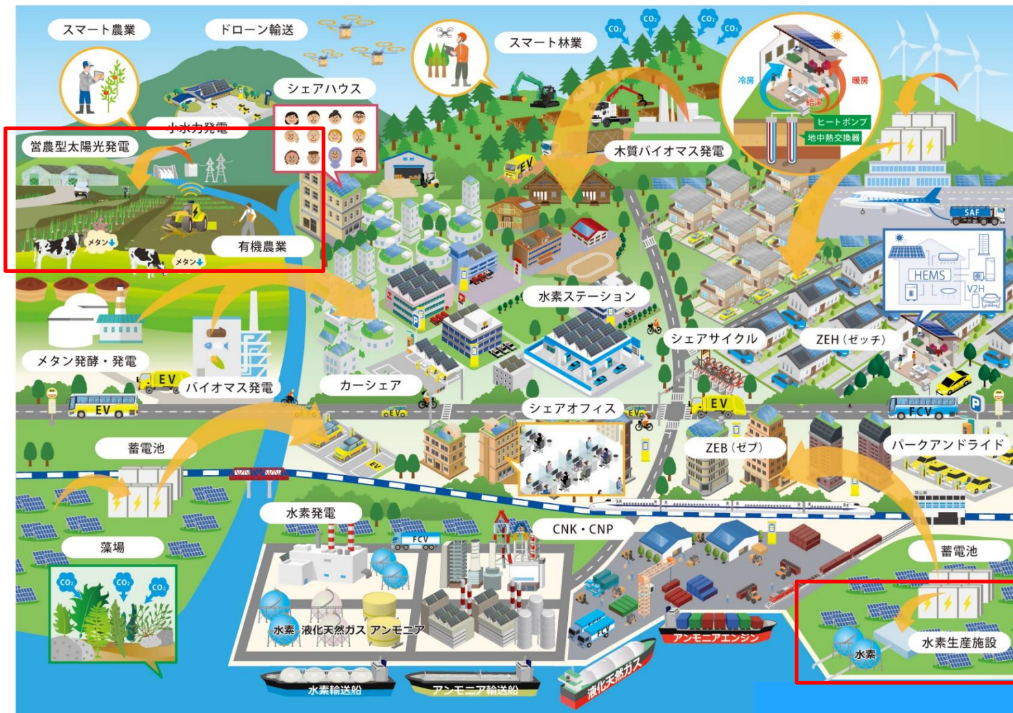
図6-1 2050年脱炭素社会のイメージ