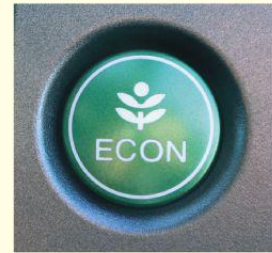
エコドライブスイッチの例

②エコドライブスイッチ * をONにしましょう。車の制御が変わって、ゆっくり加速しやすくなり、燃費が良くなります。