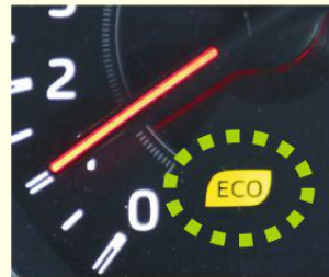
エコドライブランプの例

①エコドライブランプ * を点灯するように運転しましょう。アクセルをふんわり踏んで運転することになり、燃費が良くなります。