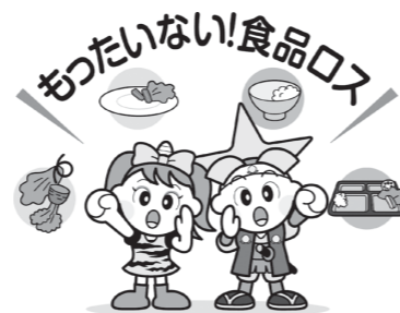
★「食品ロス」とは、まだ食べられるのに捨てられている食品のこと