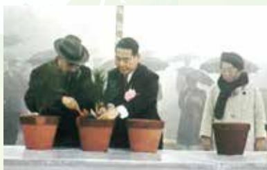
第18回 全国植樹祭の様子▶

国土緑化運動の中心的な行事で、天皇皇后両陛下のご臨席のもと、式典行事や記念植樹等を通じて、国民の森林に対する愛情を培うことを目的に毎年春に開催されています。岡山県では、昭和42年に金山山頂(岡山市)にて第18回大会を開催しており、令和6年には57年ぶり2回目となる第74回大会を岡山市内で開催します。