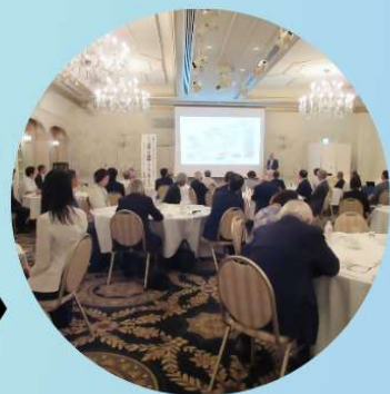
前回のサロンの様子