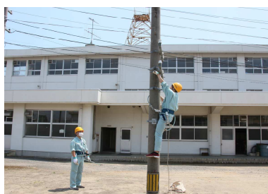
昇柱訓練をしている様子