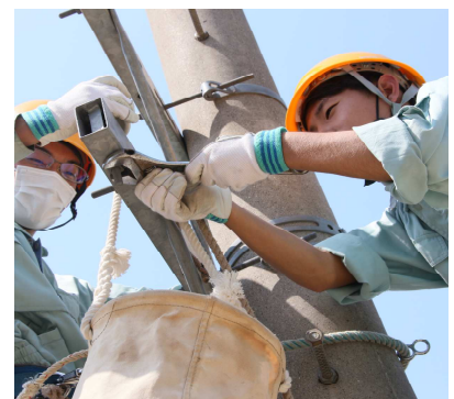
柱上作業をしている様子