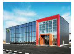
株式会社ニッカリ本社

利益の最大化を追求し、得た利益を社員に還元できる、魅力的な会社として、会社を永續させていきたいと考えています。