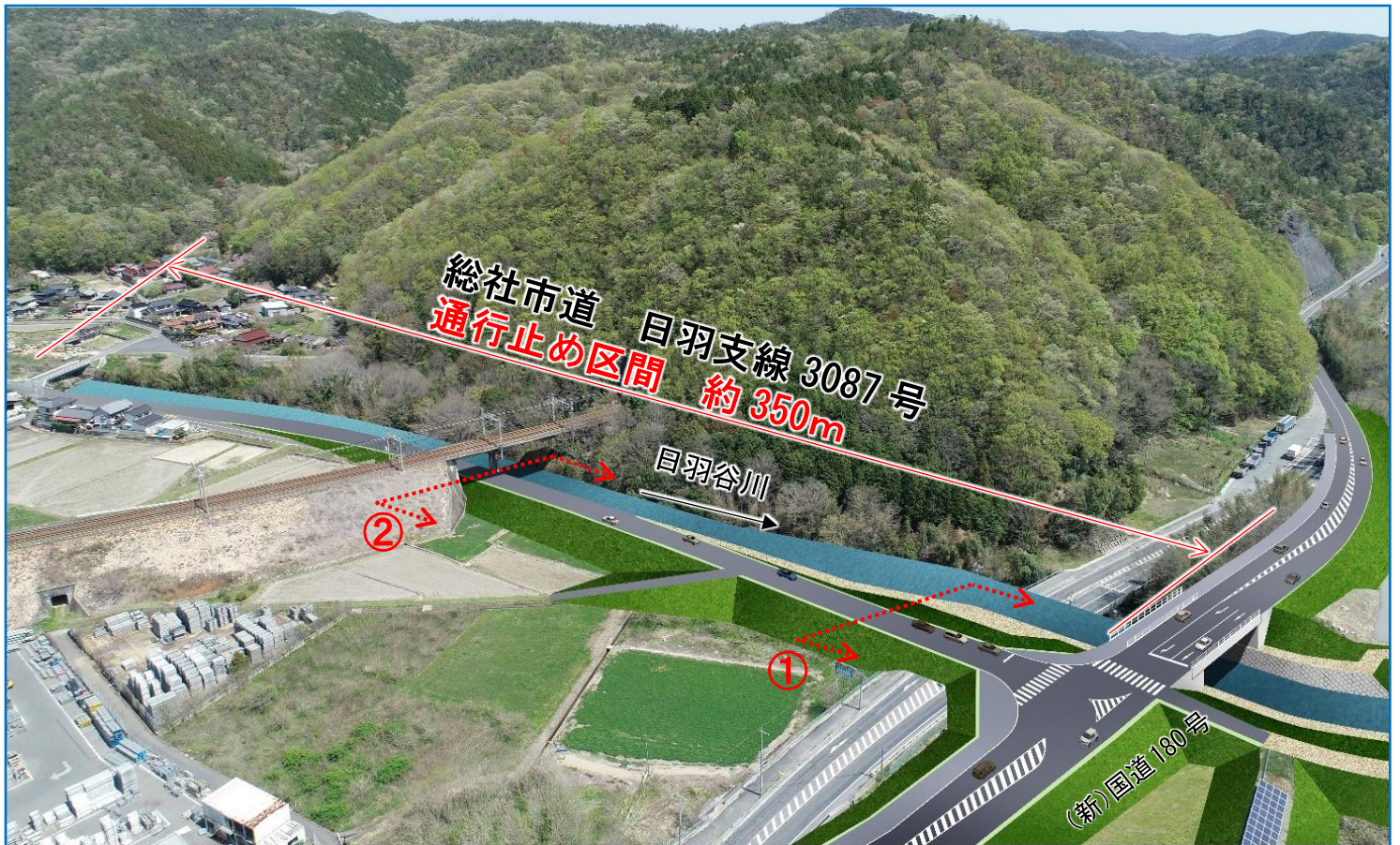
対策工事(堤防整備)イメージ

平成30年7月豪雨と同程度の出水で、河川の水が溢れないように堤防整備を行います。