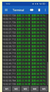
スマホ画面(イメージ)