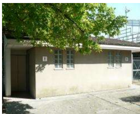
野球場 トイレ(内野西) (総合グラウンド)