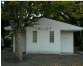
体育館 トイレ(ひょうたん池北) (総合グラウンド)