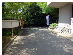
園路 アスファルト舗装 (後楽園)