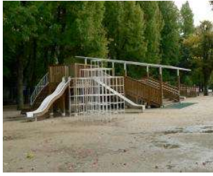
複合遊具 多目的広場 (総合グラウンド)