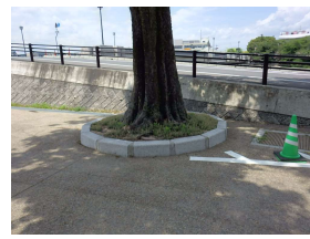
修景施設 植樹枡 (後樂園)