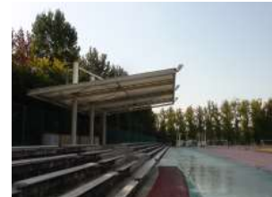
補助陸上競技場 競技運営席 (総合グラウンド)