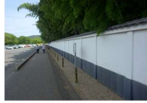
管理施設 塀(柵類) (後樂園)