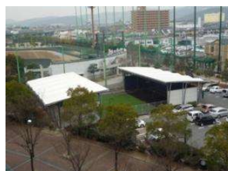
補助野球場 投球練習場 (倉敷スポーツ公園)