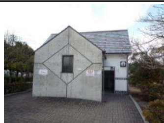
園地 トイレB (倉敷スポーツ公園)