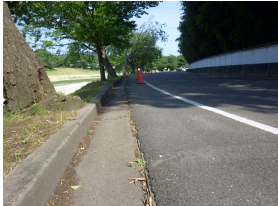
管理施設 側溝 (後樂園)