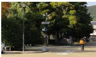
園路 照明② (総合グラウンド)