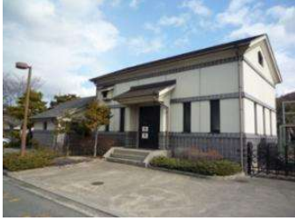
駐車場 ポンプ室上屋 (倉敷スポーツ公園)