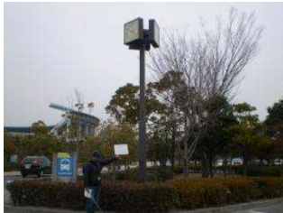
園地 時計 (倉敷スポーツ公園)