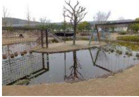
園池 池(わんぱく広場) (倉敷スポーツ公園)