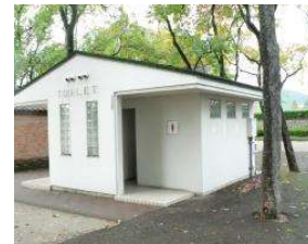
多目的広場 トイレ (総合グラウンド)