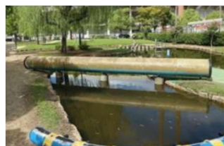
園池 不思議トンネル (倉敷スポーツ公園)