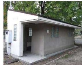
野球場 トイレ(内野東) (総合グラウンド)