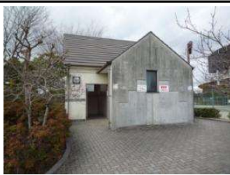
園地 トイレA (倉敷スポーツ公園)