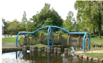
園池 スウィングトンネル (倉敷スポーツ公園)