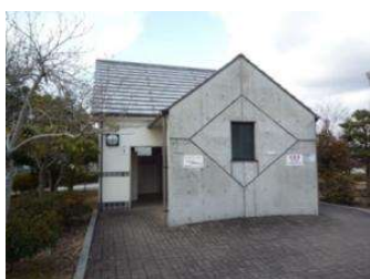
園地 トイレC (倉敷スポーツ公園)