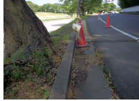
管理施設 側溝 (後樂園)