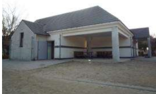
自由広場 休憩棟 (倉敷スポーツ公園)