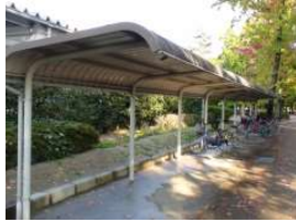
補助陸上競技場 補助陸上自転車置場 (総合グラウンド)