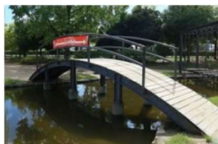
園池 たいこ橋 (倉敷スポーツ公園)