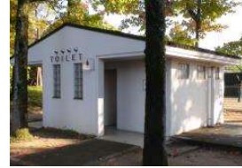
補助陸上競技場 トイレ園路南側 (総合グラウンド)