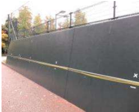
南テニスコート 擁壁(壁打ち) (総合グラウンド)