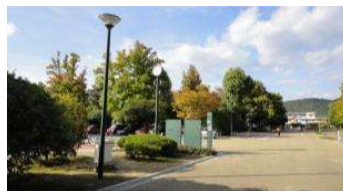
園路 時計・監視カメラ (総合グラウンド)