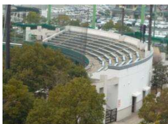
補助野球場 補助野球場 (倉敷スポーツ公園)