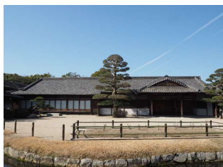
亭舎 鶴鳴館 (後楽園)