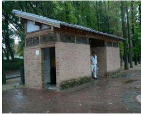
水泳場 便益施設 (総合グラウンド)