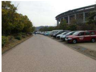
園路 舗装(カラーアスファルト) (倉敷スポーツ公園)