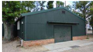
自由広場 倉庫 (総合グラウンド)