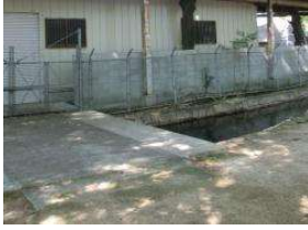
野球場 擁壁 (総合グラウンド)