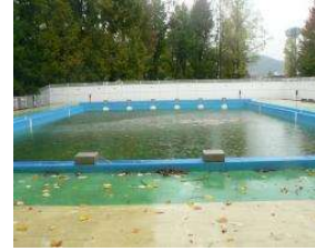
水泳場 プール(25m) (総合グラウンド)