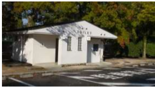
北テニスコート トイレ (総合グラウンド)