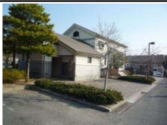
駐車場 トイレ (倉敷スポーツ公園)