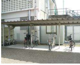
野球場 自転車置場(事務所) (総合グラウンド)