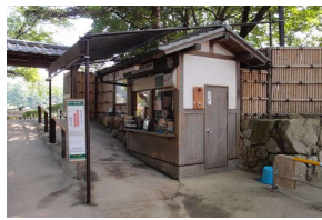
管理施設 券売施設 (後樂園)