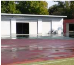
補助陸上競技場 倉庫(競技場東) (総合グラウンド)