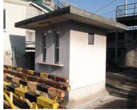
野球場 切符売場(内野西) (総合グラウンド)