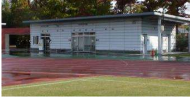
補助陸上競技場 管理棟 (総合グラウンド)