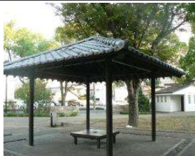
体育館 あずまや (総合グラウンド)