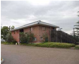
南テニスコート テニスコートクラブハウス (総合グラウンド)