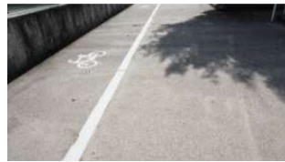
北テニスコート 駐輪場 (総合グラウンド)