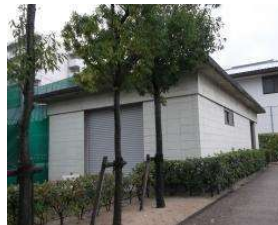
弓道場 倉庫(弓道場北) (総合グラウンド)