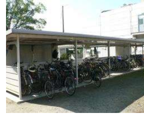
野球場 自転車置場 (総合グラウンド)