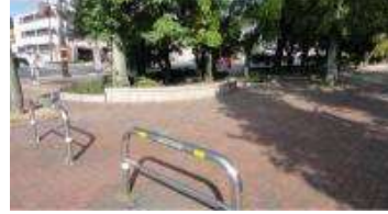
園路 舗装④ (総合グラウンド)