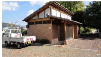
自由ひろば トイレ(自由広場西) (総合グラウンド)