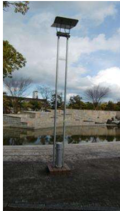
園地 園路照明B (倉敷スポーツ公園)