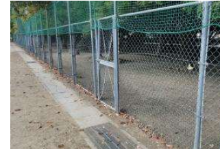
園路 フェンス (総合グラウンド)