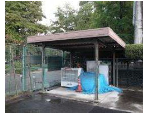
野球場 物置 (総合グラウンド)