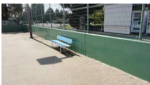
北テニスコート 擁壁(コート外周部) (総合グラウンド)