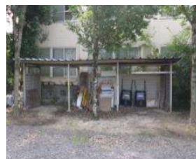
野球場 物置 (総合グラウンド)