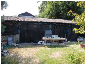
管理施設 材料置場 (後樂園)