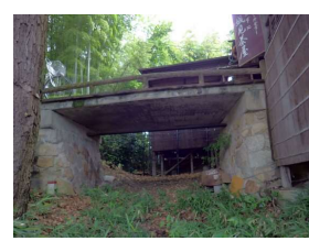
橋梁 コンクリート床版橋 (後楽園)