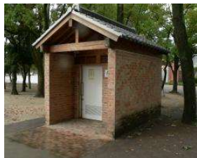
多目的広場 多目的トイレ (総合グラウンド)