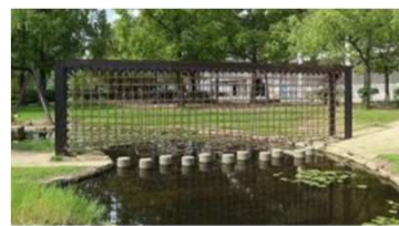
園池 ネットの壁渡り (倉敷スポーツ公園)