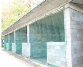
野球場 資材置場(ライトスタンド裏 2)(総合グラウンド)