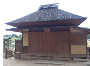
亭舎 寒翠細響軒 (後楽園)