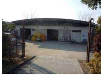
駐車場 運動用具倉庫 (倉敷スポーツ公園)