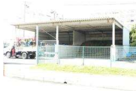
野球場 落ち葉集積場上屋 (総合グラウンド)