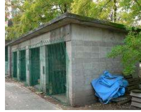
野球場 資材置場(ライトスタンド裏 1)(総合グラウンド)