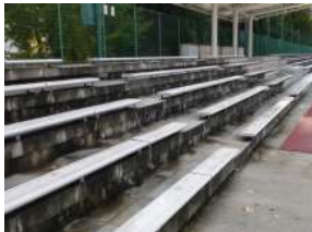
補助陸上競技場 スタンド (総合グラウンド)