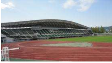
陸上競技場 メインスタンド (総合グラウンド)