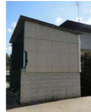
北テニスコート 砂置場 (総合グラウンド)