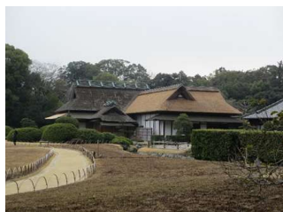
亭舎 延養亭、臨漪軒 (後楽園)