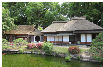
亭舎 廉池軒 (後楽園)