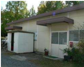
野球場 作業員詰所(野球場西 1) (総合グラウンド)