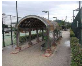
南テニスコート パーゴラ (総合グラウンド)