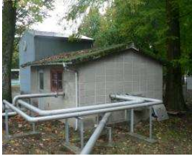
水泳場 ポンプ室 (総合グラウンド)