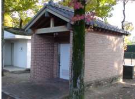
補助陸上競技場 多目的トイレ (総合グラウンド)