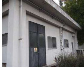
野球場 電気室 (総合グラウンド)