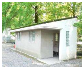
野球場 トイレ(内野東) (総合グラウンド)