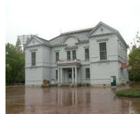
体育館 総合グラウンドクラブ (総合グラウンド)