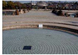
園池 池(エントランス) (倉敷スポーツ公園)