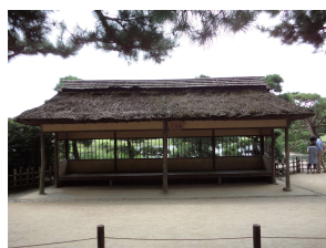
亭舎 五十三次腰掛茶屋 (後楽園)