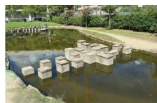
園池 でこぼこステップ (倉敷スポーツ公園)