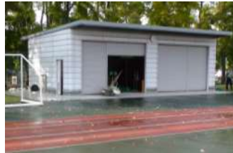
補助陸上競技場 倉庫(競技場西) (総合グラウンド)