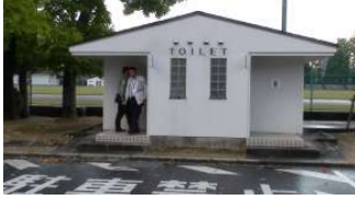
補助陸上競技場 トイレ第2駐車場南 (総合グラウンド)