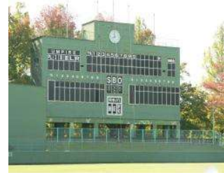
野球場 スコアボード (総合グラウンド)