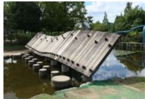
園池 斜め壁渡り (倉敷スポーツ公園)