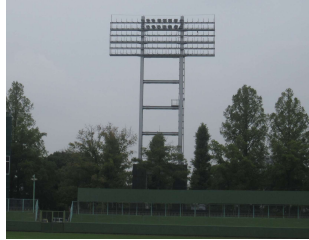
野球場 照明塔 (総合グラウンド)