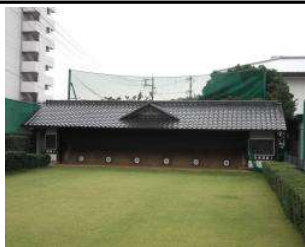
弓道場 的場 (総合グラウンド)