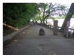
園路 未舗装 (後楽園)