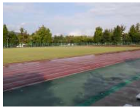
補助陸上競技場 トラック (総合グラウンド)