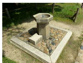
便益施設 水飲場 (倉敷スポーツ公園)