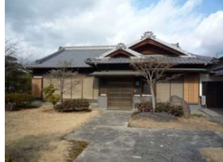
研修棟 研修棟 (倉敷スポーツ公園)