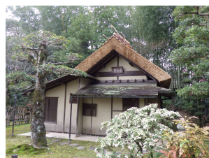
亭舎 茶祖堂 (後楽園)