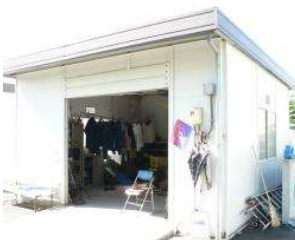
野球場 倉庫(西2) (総合グラウンド)