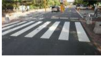
園路 舗装① (総合グラウンド)