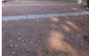
園路 舗装③ (総合グラウンド)