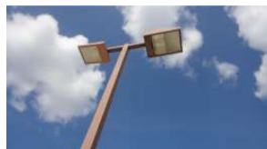
北テニスコート 照明 (総合グラウンド)