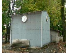
水泳場 濾過機庫 (総合グラウンド)