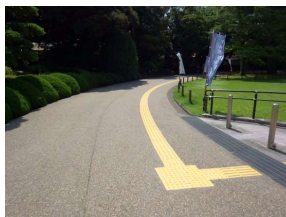
園路 舗装(カラーアスファルト) (後楽園)