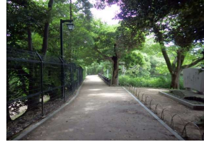
管理施設 フェンス(柵類) (後樂園)