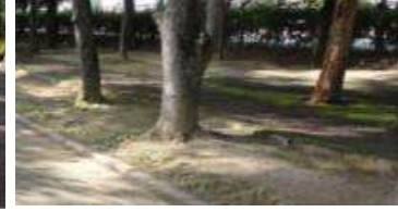
園路 舗装⑤ (総合グラウンド)