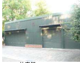
体育館 倉庫 (総合グラウンド)