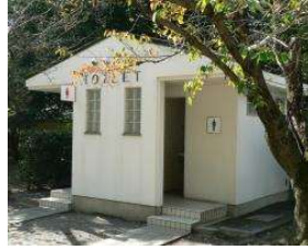
野球場 トイレ (総合グラウンド)