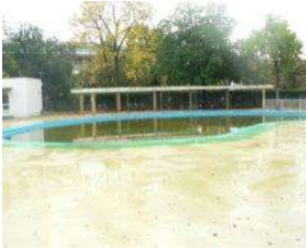
水泳場 プール(幼児) (総合グラウンド)