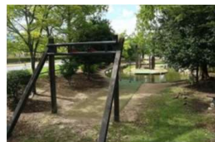
園池 スカイロープ (倉敷スポーツ公園)