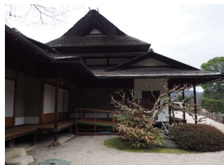
亭舎 栄唱の間 (後楽園)