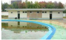
水泳場 更衣棟 (総合グラウンド)