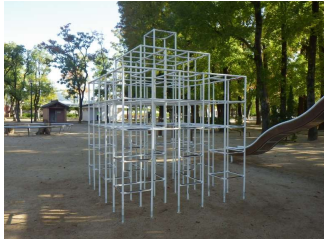
ジャングルジム 多目的広場 (総合グラウンド)