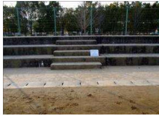
多目的広場 ステージ (倉敷スポーツ公園)