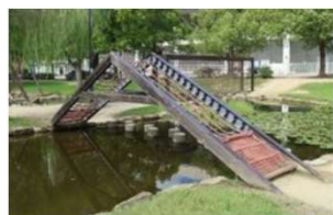
園池 ネットブリッジ (倉敷スポーツ公園)