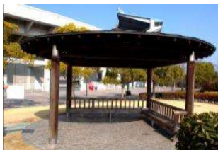
エントランス広場 四阿 (倉敷スポーツ公園)