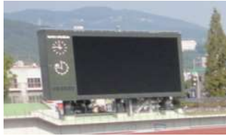
陸上競技場 大型映像装置 (総合グラウンド)