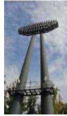
陸上競技場 照明塔 (総合グラウンド)