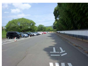
便益施設 駐車場 (倉敷スポーツ公園)