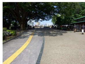
園路 インターロッキング舗装 (後楽園)