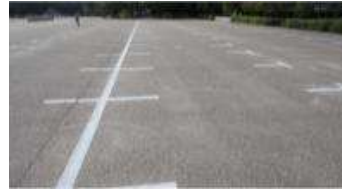
園路 舗装② (総合グラウンド)