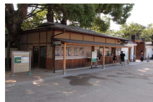
管理施設 券売施設 (後樂園)