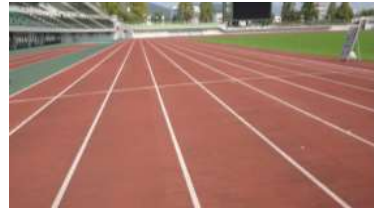
陸上競技場 トラック (総合グラウンド)