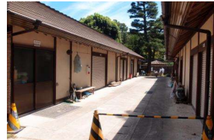
管理施設 管理棟 (後樂園)