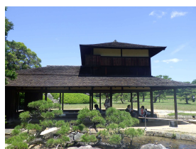
亭舎 流店 (後楽園)