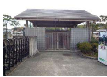
駐車場 ゴミ集積場 (倉敷スポーツ公園)