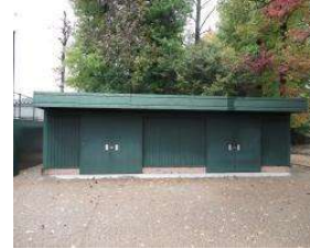
南テニスコート 倉庫(新設) (総合グラウンド)