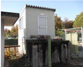
野球場 ポンプ室 (総合グラウンド)