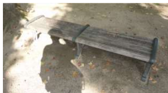
園路 ベンチ (総合グラウンド)