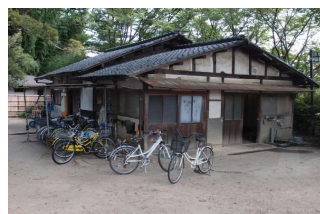
管理施設 管理棟 (後樂園)