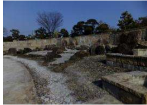
園池 池(壁泉) (倉敷スポーツ公園)