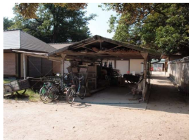
管理施設 材料置場 (後樂園)