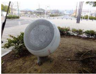
園地 園路照明A (倉敷スポーツ公園)