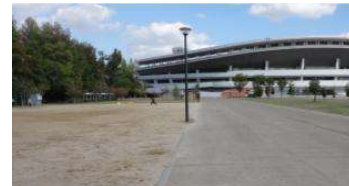
園路 照明① (総合グラウンド)