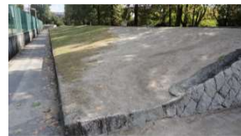
北テニスコート 擁壁(観覧席部) (総合グラウンド)