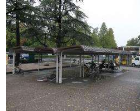
南テニスコート 自転車置場 (総合グラウンド)