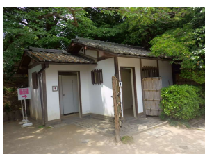
便益施設便所 (後楽園)