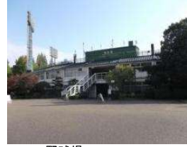
野球場 事務所本館 (総合グラウンド)