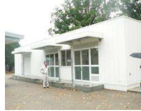
水泳場 管理棟 (総合グラウンド)