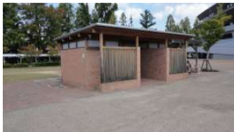
自由ひろば トイレ(自由広場東) (総合グラウンド)