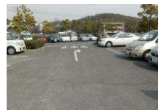
園路 舗装(アスファルト) (倉敷スポーツ公園)