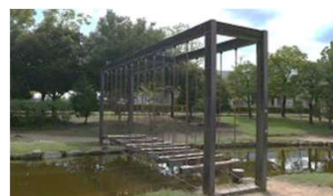
園池 ゆらゆら橋 (倉敷スポーツ公園)