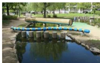
園池 くねくねパイプ (倉敷スポーツ公園)