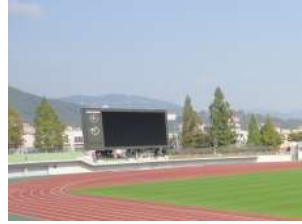
陸上競技場 サイドスタンド (総合グラウンド)