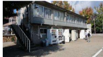
北テニスコート 北テニスコート本館 (総合グラウンド)