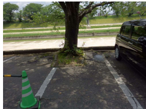
修景施設 植樹枡 (後樂園)