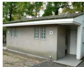
野球場 トイレ(外野西) (総合グラウンド)