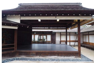
亭舎 能舞台 (後楽園)