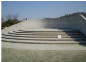
イベント広場 ステージ (倉敷スポーツ公園)