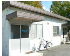
野球場 作業員詰所(野球場西 2) (総合グラウンド)