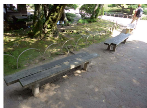
休養施設 ベンチ (後樂園)