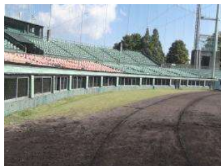
野球場 スタンド(特別内野席) (総合グラウンド)