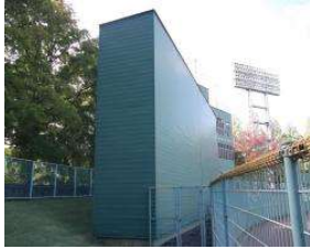
野球場 バックスクリーン (総合グラウンド)