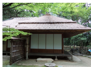
亭舎 茂松庵 (後楽園)