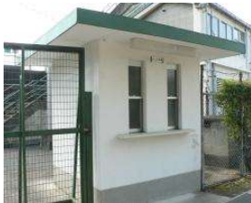
野球場 切符売場(内野東) (総合グラウンド)