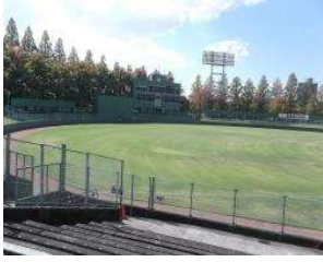
野球場 スタンド(外野席) (総合グラウンド)