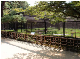
管理施設 鶴舎(保護繁殖施設) (後樂園)