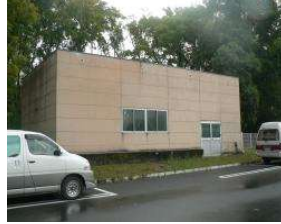
水泳場 機械室 (総合グラウンド)