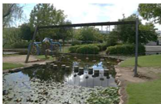
園池 ステップブリッジ (倉敷スポーツ公園)