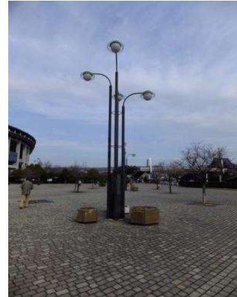
園地 園路照明C (倉敷スポーツ公園)