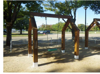
ブランコA,B 多目的広場 (総合グラウンド)