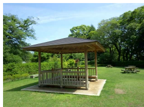
休養施設 四阿 (後樂園)