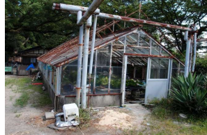
管理施設 材料置場 (後樂園)