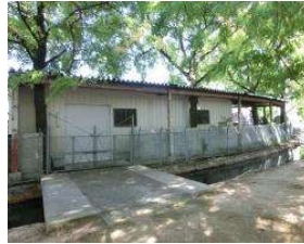
野球場 倉庫(材料置場) (総合グラウンド)