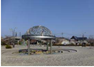
エントランス広場 噴水 (倉敷スポーツ公園)