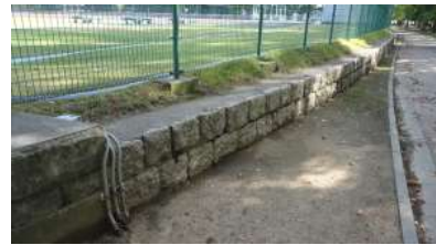
補助陸上競技場 擁壁 (総合グラウンド)