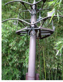
管理施設 大型照明柱 (後樂園)