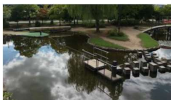
園池 ロープいかだ (倉敷スポーツ公園)