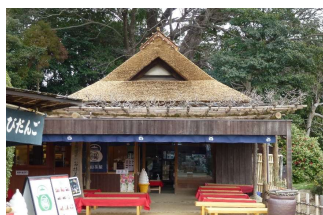
亭舎 福田屋 (後楽園)