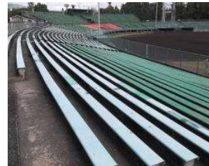
野球場 スタンド(内野席) (総合グラウンド)