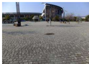
園路 舗装(インターロッキング) (倉敷スポーツ公園)