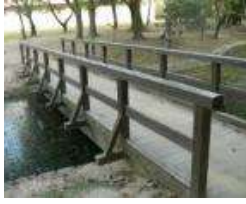
体育館 木橋(ひょうたん池) (総合グラウンド)