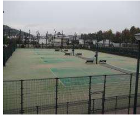
南テニスコート テニスコート (総合グラウンド)