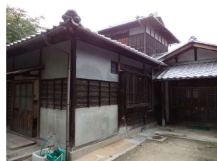
亭舎 鶴鳴館本管 (後楽園)