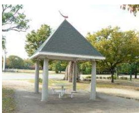
多目的広場 あずまや (総合グラウンド)