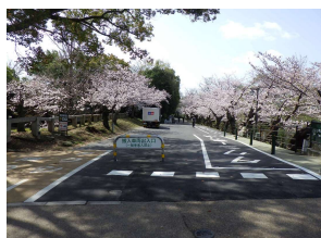
園路 コンクリート舗装 (後楽園)