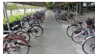
自由ひろば 自転車置場 (総合グラウンド)