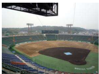
野球場 野球場 (倉敷スポーツ公園)