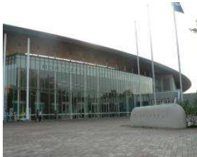
体育館 (総合グラウンド)