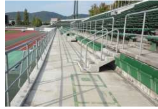
陸上競技場 バックスタンド (総合グラウンド)