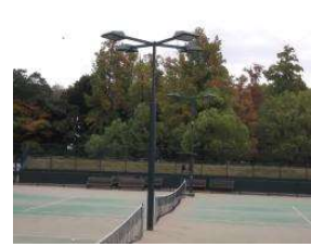
南テニスコート 照明 (総合グラウンド)