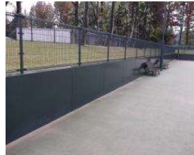
南テニスコート 擁壁(コート外周部) (総合グラウンド)