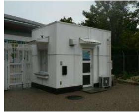
水泳場 プール発券所 (総合グラウンド)