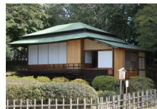
亭舎 新殿 (後楽園)