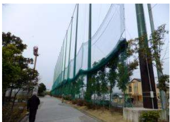
補助野球場 防球ネット (倉敷スポーツ公園)