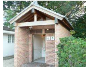
体育館 多目的トイレ (総合グラウンド)