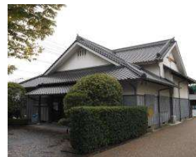
弓道場 弓場 (総合グラウンド)