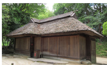
亭舎 観騎亭 (後楽園)