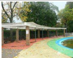
水泳場 パーゴラ (総合グラウンド)