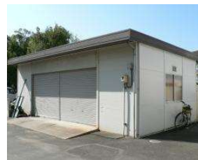
野球場 倉庫(西1) (総合グラウンド)