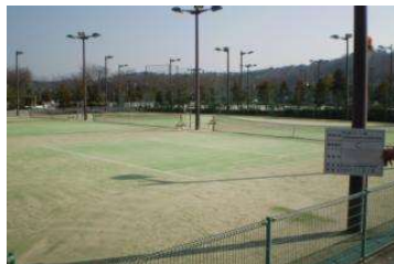
テニスコート テニスコート・照明 (倉敷スポーツ公園)