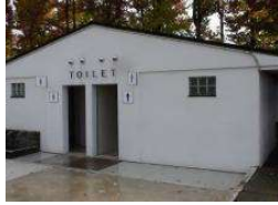
補助陸上競技場 トイレ園路北側 (総合グラウンド)