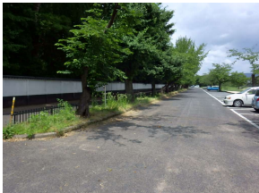
修景施設 植樹枡 (後樂園)