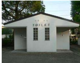
体育館 トイレ(ひょうたん池南) (総合グラウンド)