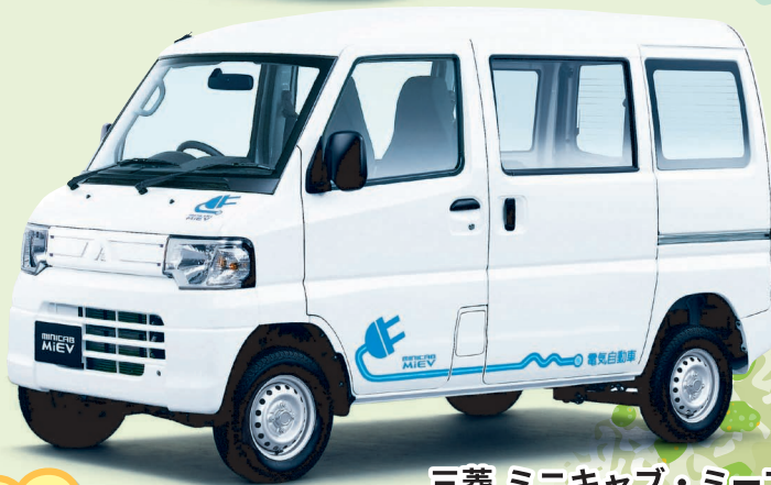
三菱 ミニキャブ・ミーブ