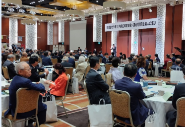
ふるさとの話題で賑やかに