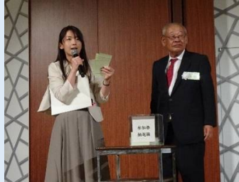
地元名産品の福引大会