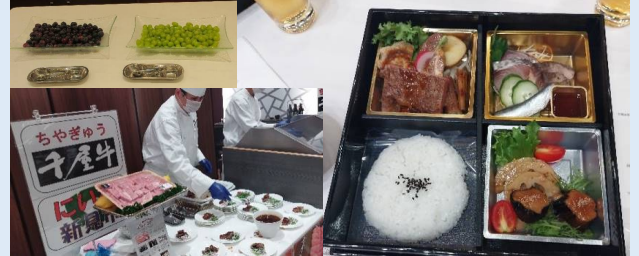
郷土の食材に舌鼓