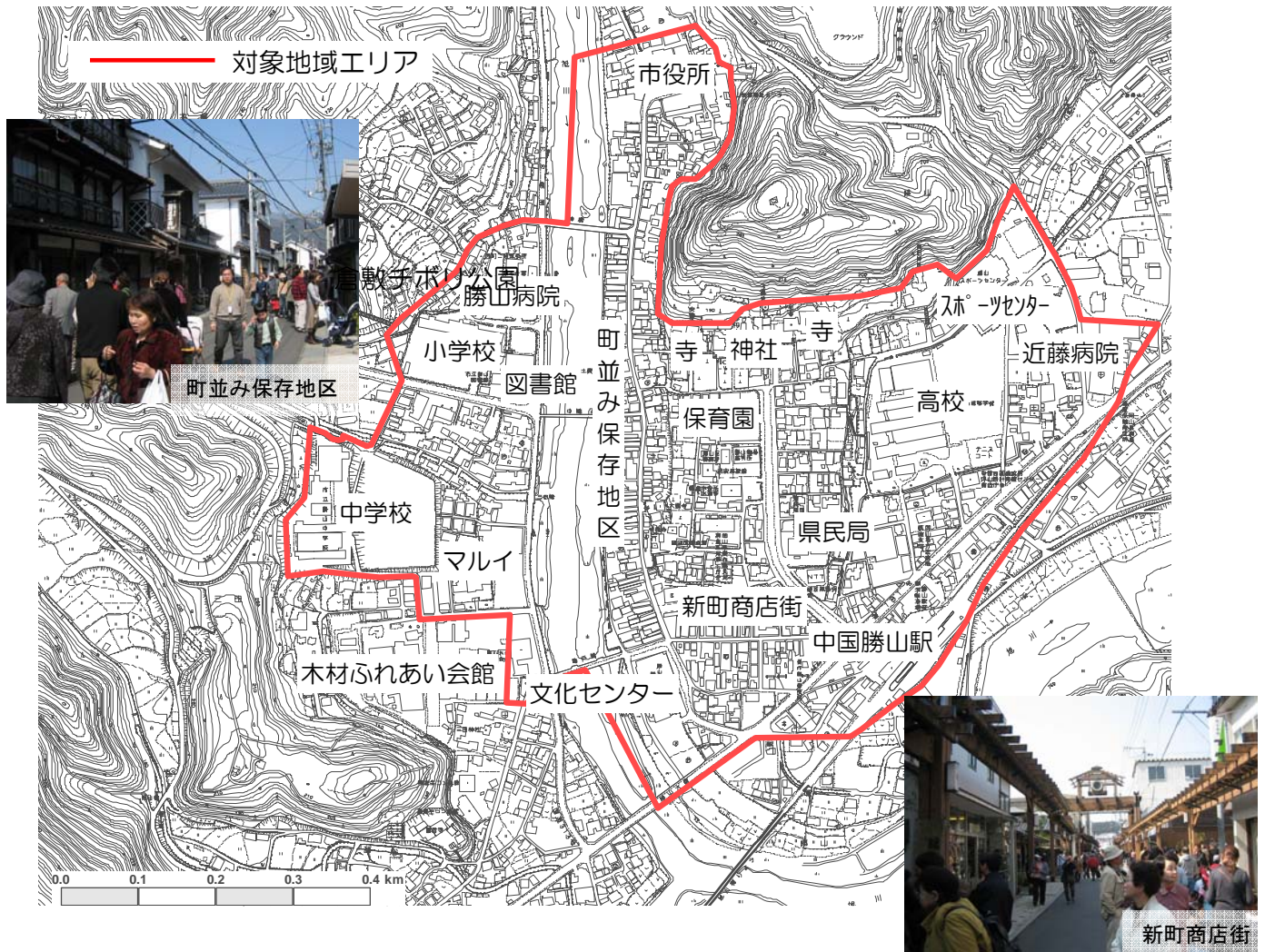
真庭市勝山地区での対象地域の設定例