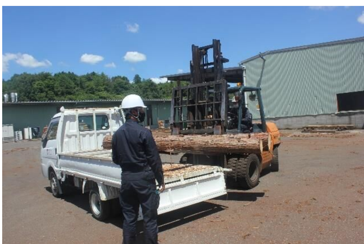
製材工場持ち込み