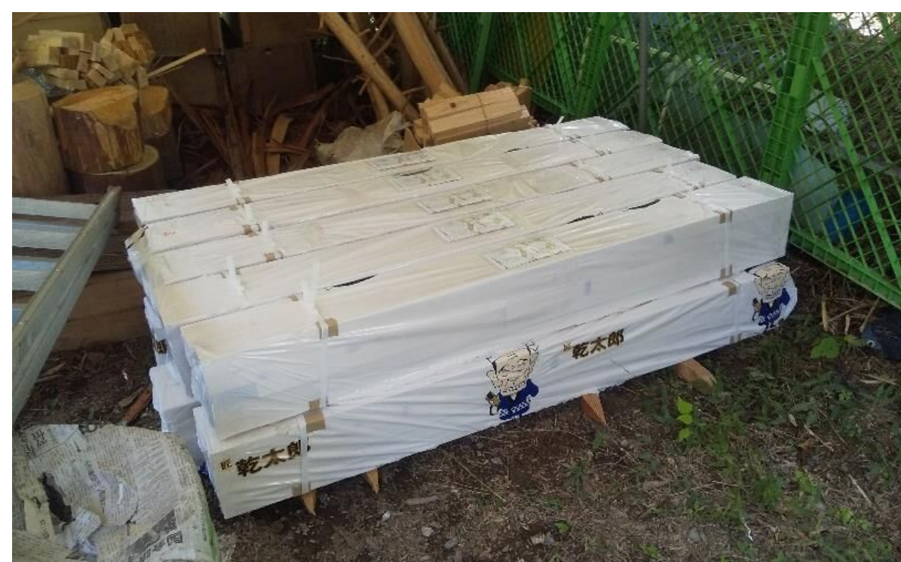
ベンチ製材出来上がり伊部つながりの森持ち込み