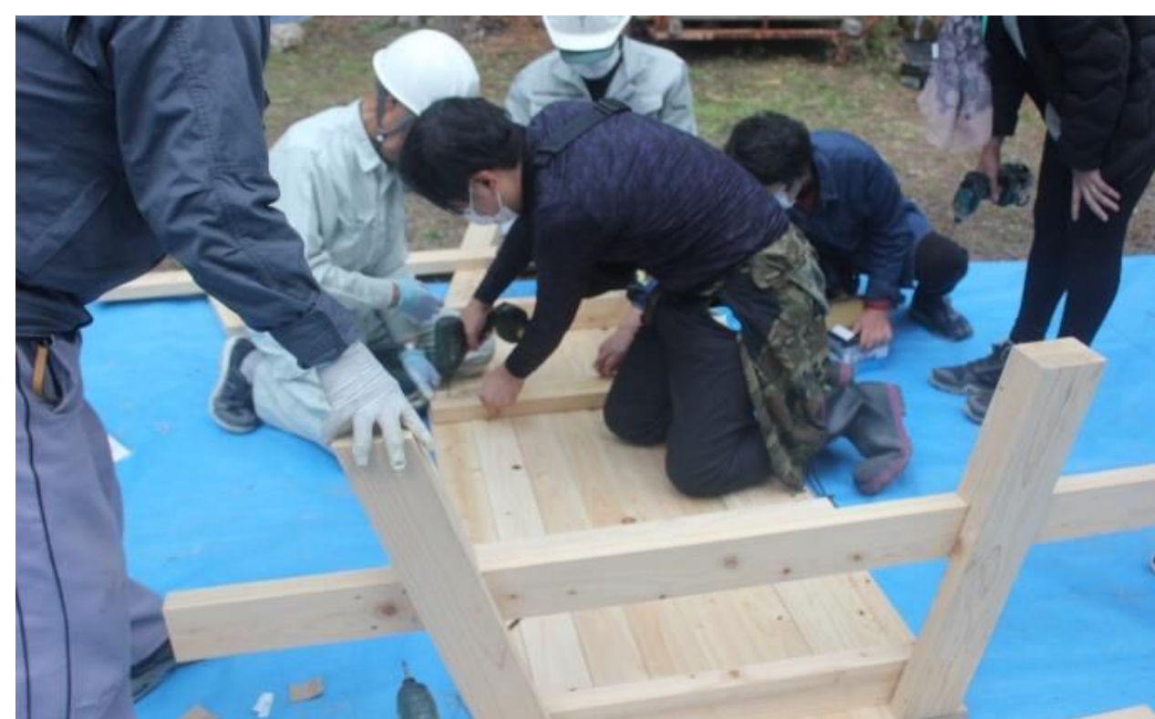
ベンチ組み立てのワークショップ実施